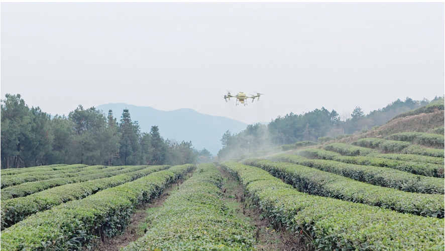
为确保茶叶安全越冬,提升来年茶叶品质与产量,近段时间以来,石阡县农业农村部门主动担当作为,正确引导助农社会化服务企业及专业合作社,运用无人机等现代设备,加大冬季茶叶管护,促进茶叶管护提质增效。