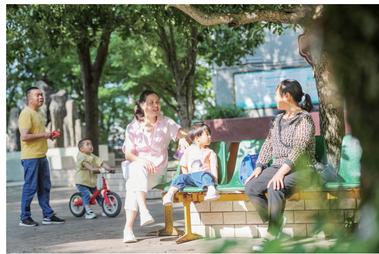
居民在改造后的文昌阁小区休闲聊天。

你点我查·红黑榜、两代表一委员、热心群众担任义务监督员……对环境、秩序、基建等开展监督,激发群众参与创文“主人翁”意识,公示餐饮卫生、交通不文明等问题35起,群众好评率100%。