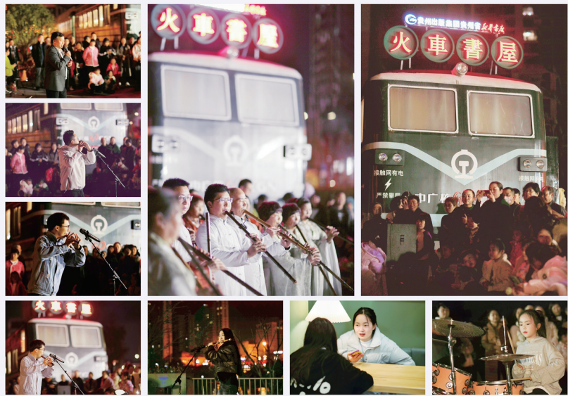
火车书屋及聆听音乐会。