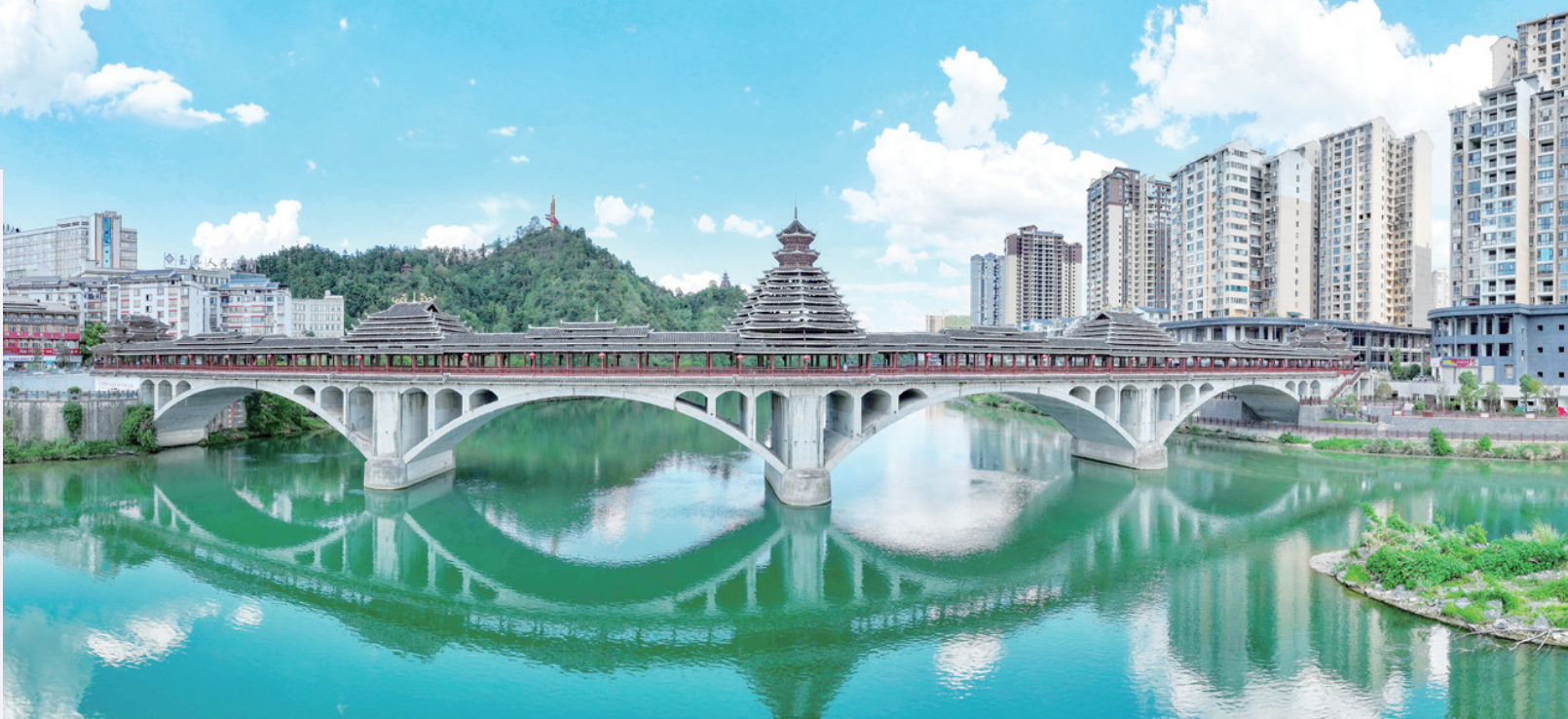
玉屏城区横跨舞阳河的风雨桥。