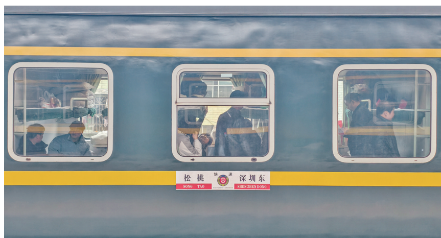
↑铜仁籍务工人员乘坐“点对点”免费返岗专列前往东莞等地返岗复工。