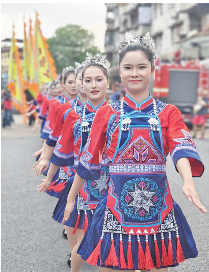
沿河土家摆手舞亮相东莞。