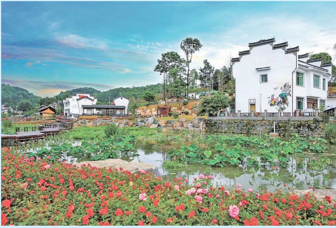
乘着莞铜协作的东风,万山区青年湖村黄家寨成为远近闻名的和美乡村。