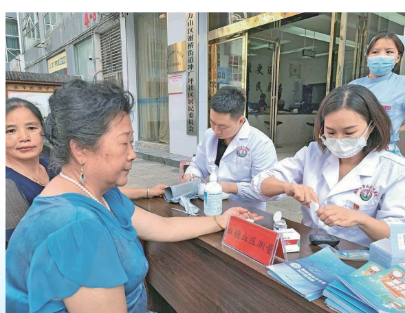
←东莞市东城医院帮扶专家在万山区谢桥街道开展健康义诊活动。