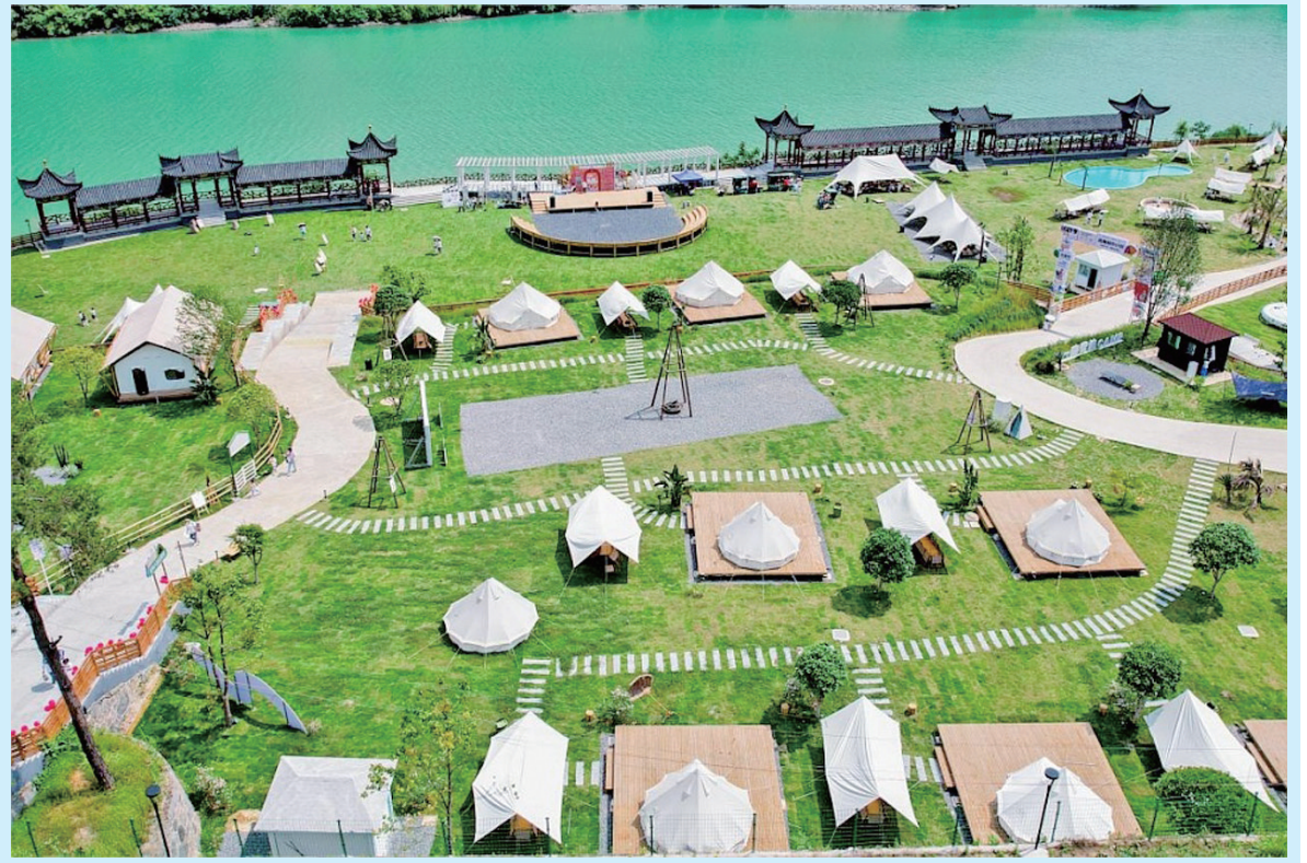
碧江区溪头镇九龙村引入东西部协作资金打造露营地、民宿,吸引了众多市民游客。