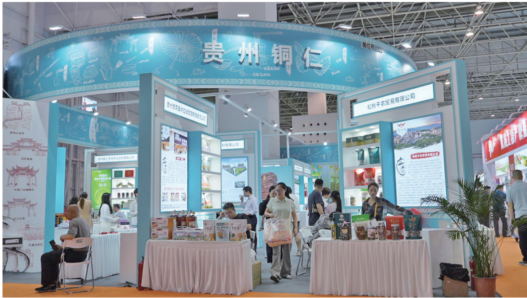
铜仁组团参加在东莞举办的“2025食博会·预博会和农博会”。