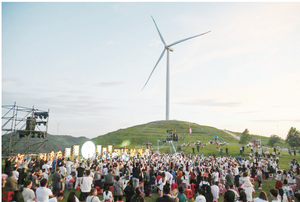
音乐会现场。

当城市被35℃+的热浪包裹,总有人在江口找到降温密码——夜宿太平河畔“行驿云舍”,玩水、看电影、吃农家菜,连夜色都带着凉丝丝的甜。