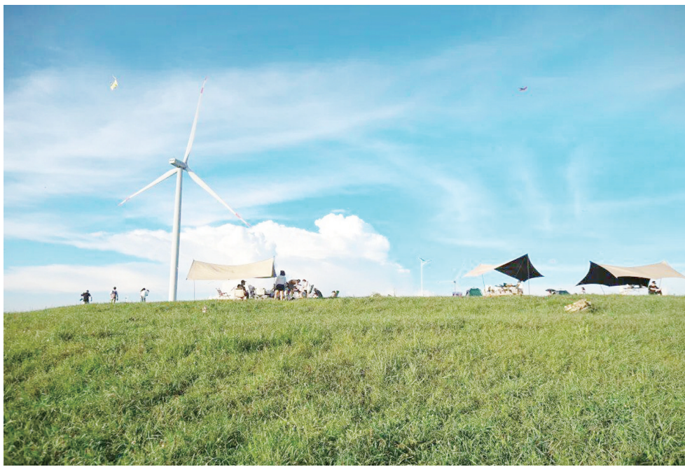
草海“大风车”。

为了让融合走得更稳更远,盘石镇通过多渠道开展招商引资,引进有实力、有资质的旅游开发投资公司,加大投资开发力度,完善基础设施,同步围绕其地貌奇观中的红石天坑、天缝、天洞、天柱等,聘请规划设计单位规划,联合响水飞瀑与黔东草海共同谋划“两海一瀑”景区内的旅游项目、打卡景点、民宿建设、文化活动。一系列举措之下,农文旅融合的种子在盘石镇扎根,正顺着生态与文化的脉络,生长出更繁茂的未来。