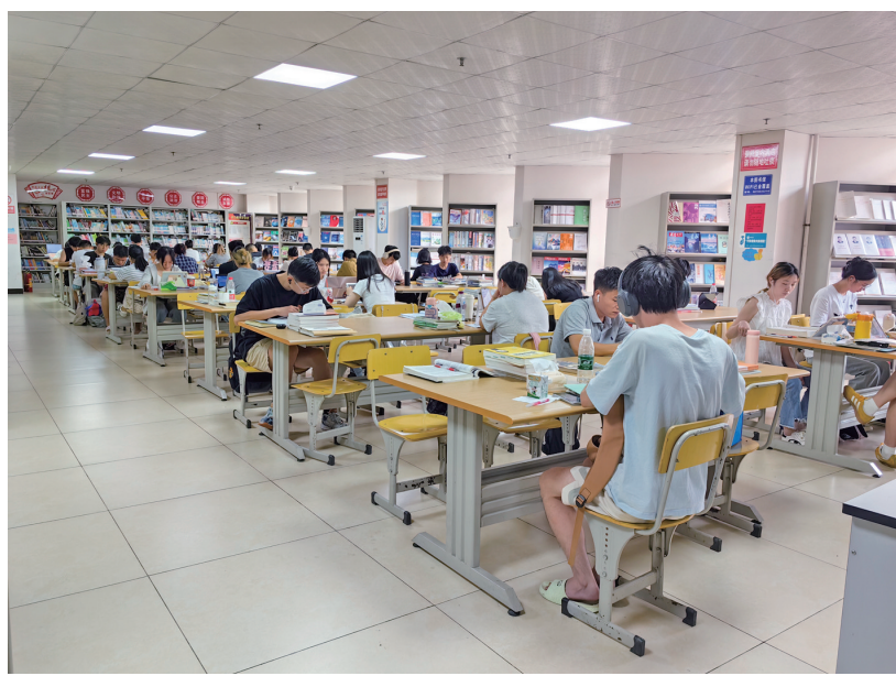
本报讯(白雪 王超 文/图) 暑气蒸腾,热浪翻滚。在高温炙烤下,石阡不少市民选择在图书馆和书店等清凉地“避暑充电”,以安静阅读、