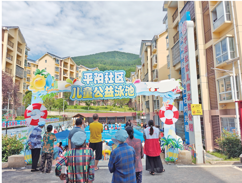
本报讯(吴梓杨 李厅木 肖青青 文/图) 为有效降低溺水风险,石阡县汤山街道、泉都街道等地采取“疏堵结合”模式,全力为孩子们筑牢暑期防溺水安全屏障。