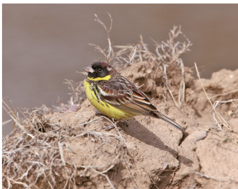
黄胸鹀——国家一级重点保护野生动物。王天治 摄