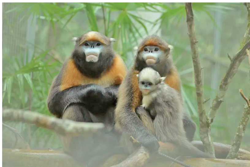
黔金丝猴——国家一级重点保护野生动物。