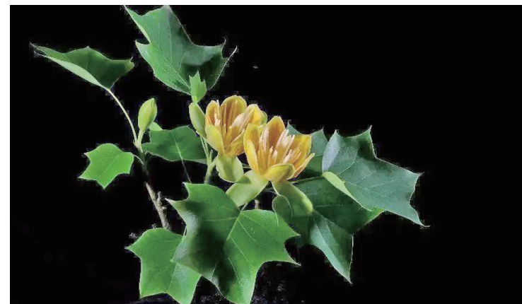
鹅掌楸——国家二级保护植物。

除此之外 生活在梵净山这座生态王国的动植物还有很多很多 它们不是书本里的标本 而是与我们共享这片土地的邻居