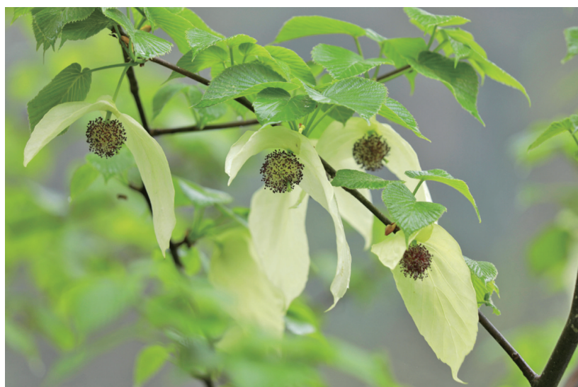
珙桐——国家一级保护植物。