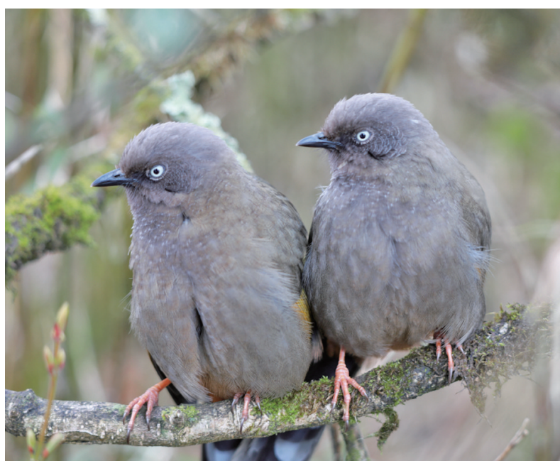
橙翅噪鹛——国家二级重点保护野生动物。