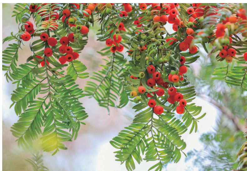
红豆杉——国家一级保护植物。