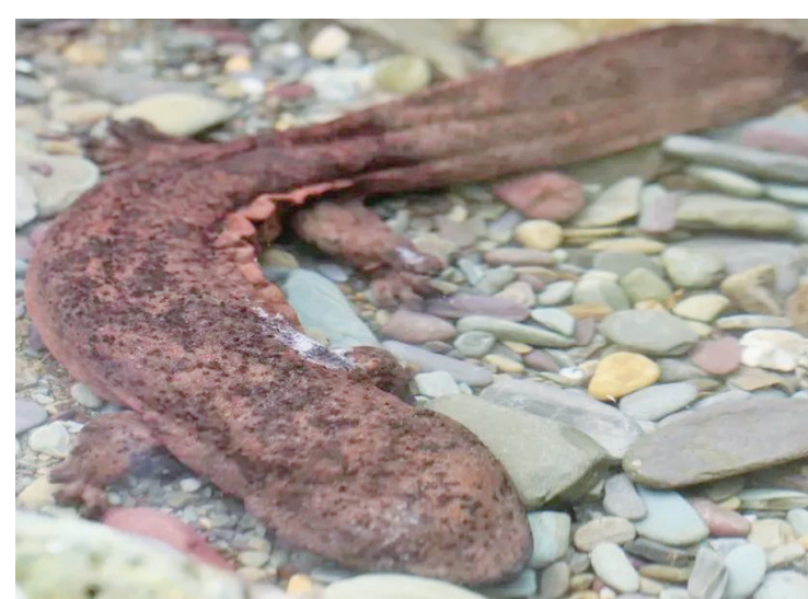
大鲵——国家二级重点保护野生动物。