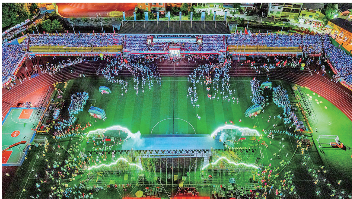
市第五届运动会在石阡县体育场开幕。