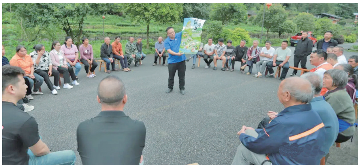
村民聆听宣讲。