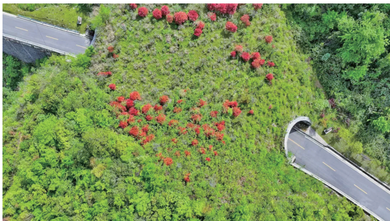
梵净山生态廊道。