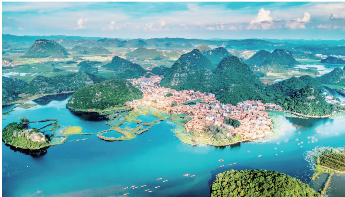
生态宜居的仙人洞村。

整治后的村里,再也不见污秽不堪的排水沟,地下埋设的一根根管网将全村生活污水引入污水处理站。