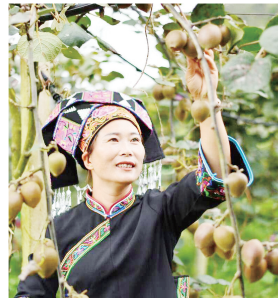
三光村出产猕猴桃。

说干就干。依托国家石漠公园4A景区的金字招牌,三光村先后引进浩弘农业、兴牧业等龙头企