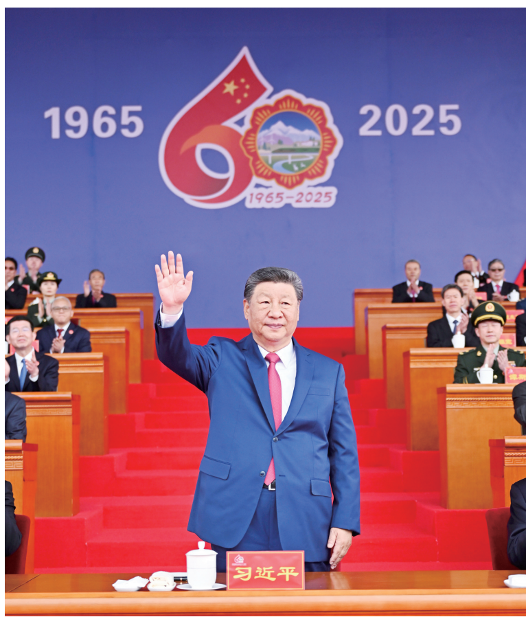
8月21日上午，西藏各族各界干部群众约2万人欢聚拉萨市布达拉宫广场，热烈庆祝西藏自治区成立60周年。中共中央总书记、国家主席、中央军委主席习近平出席庆祝大会。