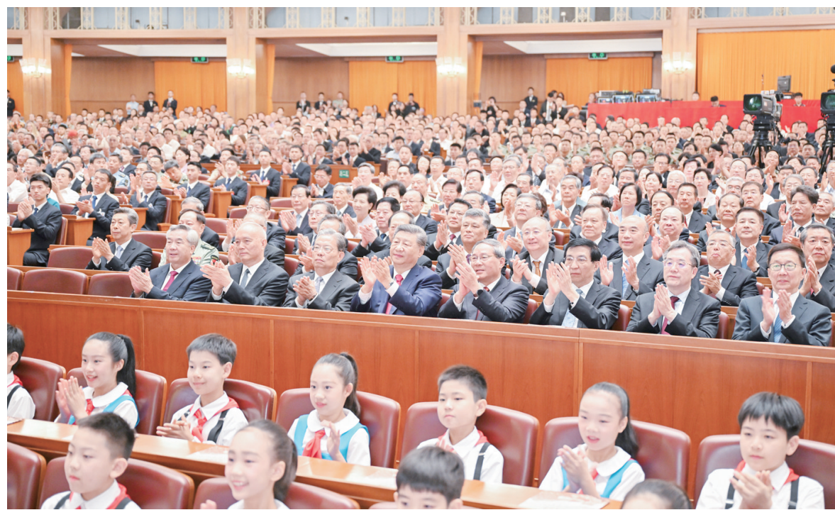
9月3日,纪念中国人民抗日战争暨世界反法西斯战争胜利80周年文艺晚会《正义必胜》在北京人民大会堂隆重举行。习近平、李强、赵乐际、王沪宁、蔡奇、丁薛祥、李希、韩正等党和国家领导人,与约6000名中外人士一起观看晚会。

人民日报北京9月3日电 歌声嘹亮,唱响胜利华章;舞姿雄壮,展现正义力量。纪念中国人民抗日战争暨世界反法西斯战争胜利80周年文艺晚会《正义必胜》3日晚在北京人民大会堂隆重举行。习近平、李强、赵乐际、王沪宁、蔡奇、丁薛祥、李希、韩正等党和国家领导人,与约6000名中外人士一起观看晚会,共同纪念这个光辉的日子。人民大会堂万人大会堂灯火辉煌,二楼舞台悬挂着“铭记历史 缅怀先烈 珍爱和平 开创未来”的横幅。舞台正中,“正义必胜”4个金色大字熠熠生辉,庄严雄伟的长城造型象征着中华民族不屈的精神脊梁。晚会开始前,少先队员向前来观看演出的抗战老战士老同志代表献花。随后,老战士老同志们在少先队员的簇拥下,来到大礼堂观众席就座,全场起立报以热烈掌声,向他们致以崇高敬意。19时55分许,欢快的迎宾曲响起,习近平等老同志步入大礼堂,同抗战老战士老同志代表亲切握手。在8声庄严肃穆的钟声中,音诗画《山河铭记》拉开整场晚会的序幕。第一场“怒吼吧,黄河”中,情境表演《中华民族到了