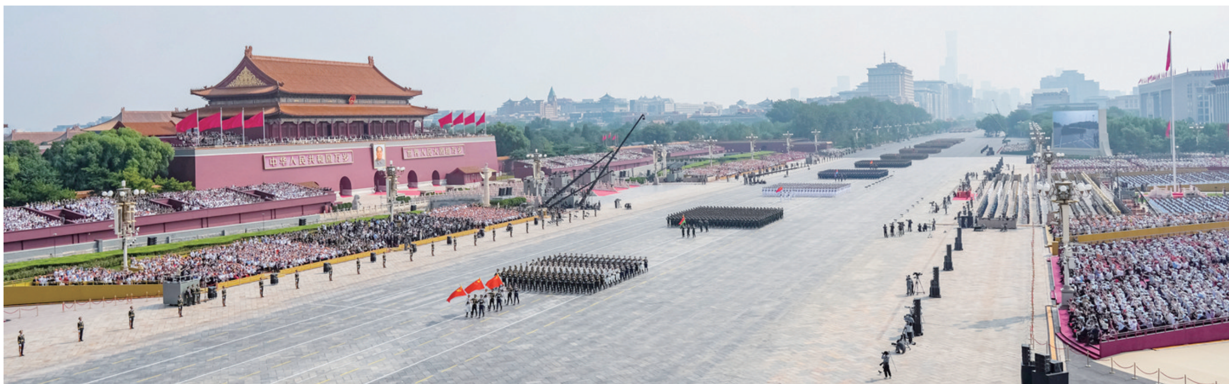
9月3日,纪念中国人民抗日战争暨世界反法西斯战争胜利80周年大会在北京隆重举行。这是徒步方队接受检阅。

习近平最后强调,中华民族伟大复兴势不可挡!人类和平与发展的崇高事业必将胜利! (下转2版)