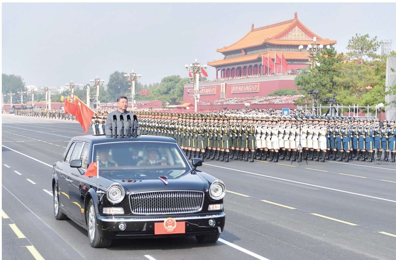
9月3日,纪念中国人民抗日战争暨世界反法西斯战争胜利80周年大会在北京天安门广场隆重举行。这是中共中央总书记、国家主席、中央军委主席习近平检阅受阅部队。

新华社北京9月3日电 铭记伟大历史胜利,凝聚正义和平力量。9月3日上午,纪念中国人民抗日战争暨世界反法西斯战争胜利80周年大会在北京天安门广场隆重举行,以盛大阅兵仪式,同世界人民一道纪念这个伟大的日子,共同开创更加光明的未来。中共中央总书记、国家主席、中央军委主席习近平发表重要讲话并检阅受阅部队。