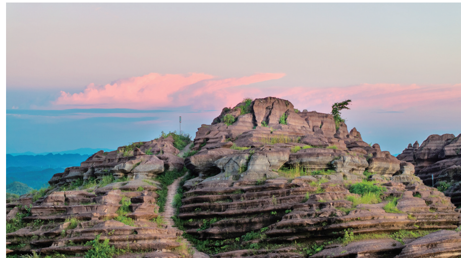
红石林夕阳。

清晨时分,随着第一缕阳光越过山脊,温柔的光线逐渐漫过赤红色的岩石,原本沉静的岩群被镀上暖金,如自然画卷徐徐展开。