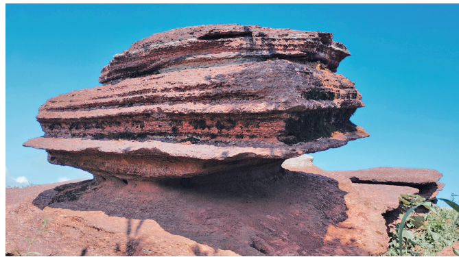
红石林怪石嶙峋。