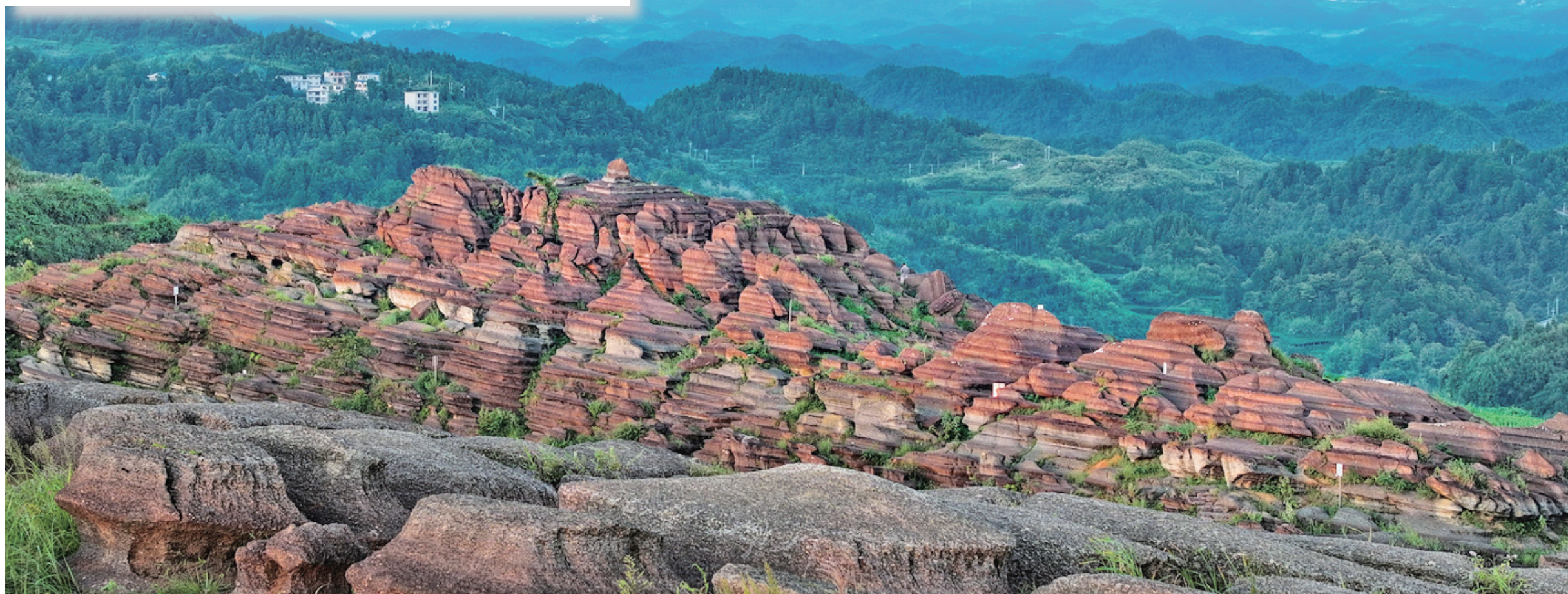
远眺红石林。