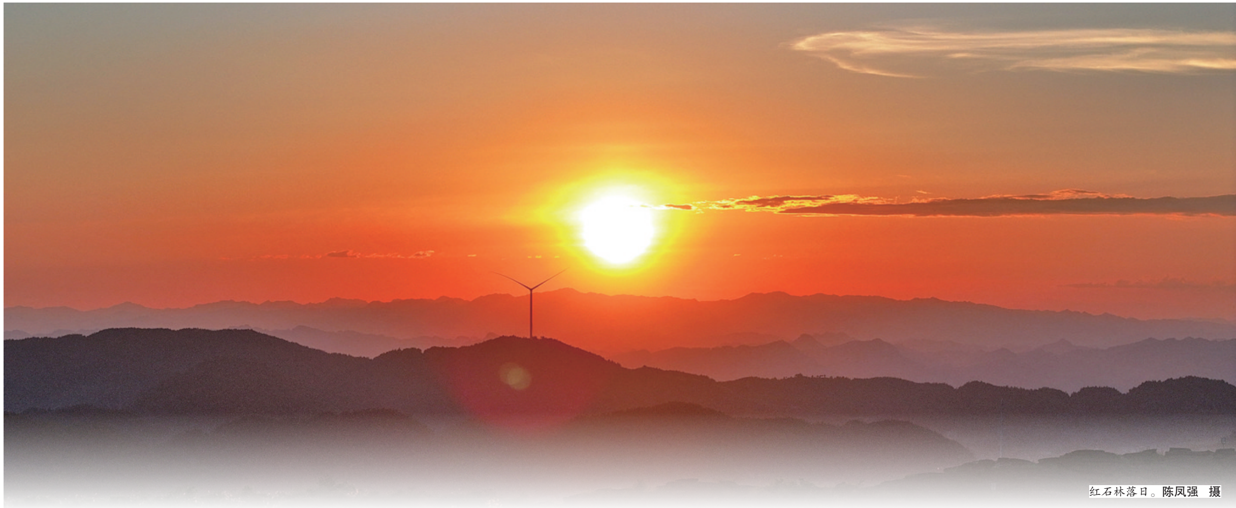
红石林落日。