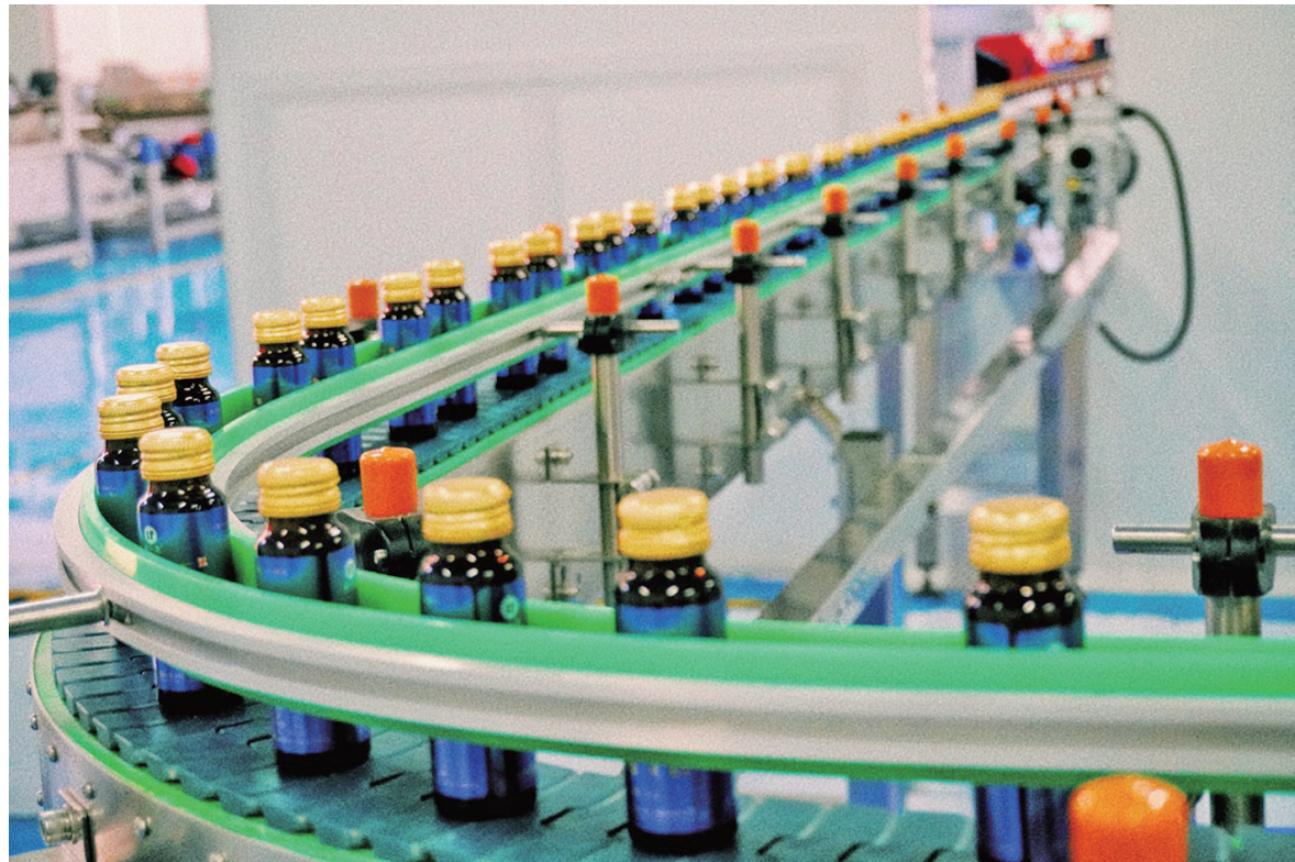
经过灭菌、灌装、贴标等工序后,口感鲜甜的天麻露完成出厂。