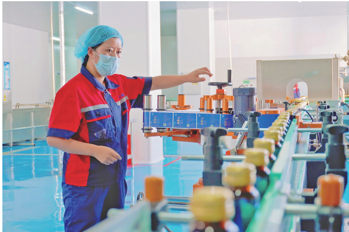
德江县经济开发区,红品天麻产业发展有限公司厂房里,工人忙碌在天麻露生产线上。