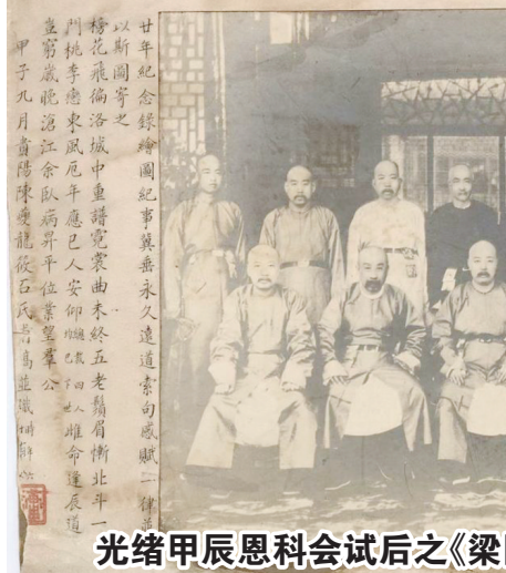
光绪甲辰恩科会试后之《梁园春宴图》,贵州陈夔龙题笺

革新浪潮席卷神州。朝廷推行新政,将进士馆的学习进士官费派往日本留学。据《清国留学生法政速成科纪事》载,光绪三十年十月,进士馆的学习主事唐桂馨,留学于日本东京政法大学法政速成科,成为第一期第二班的修业生——该班共有留学生273人,官费生181名,姚华、熊范舆、汪精卫、陈叔通等为其同班同学。