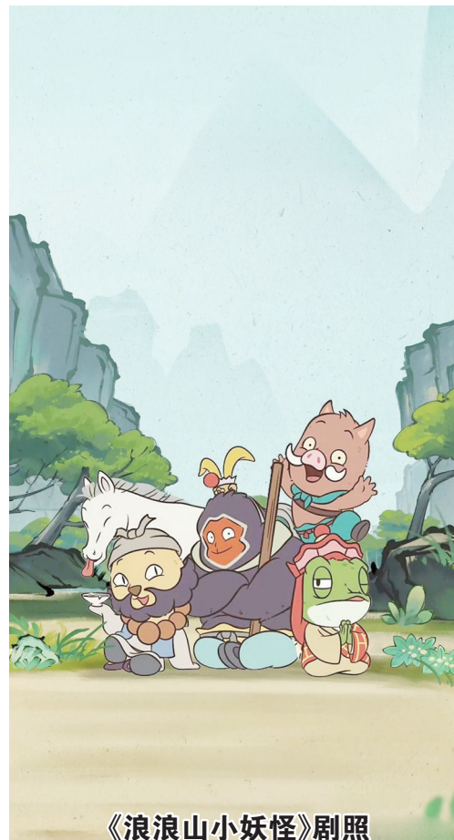
《浪浪山小妖怪》剧照

由于水执导上海美术电影制片厂出品的《浪浪山小妖怪》改编自《中国奇谭》之《小妖怪的夏天》。影片以喜剧为基调,融合传统西游元素与现代叙事,讲述了小猪妖、蛤蟆精、黄鼠狼精、猩猩怪组成“草根取经团”后的一段跌宕起伏的西行冒险之旅的故事。根据猫眼提供的数据,上映短短30多天的时间,票房已经突破了15亿。观众为啥心甘情愿掏钱?一句话:影片讲了好几个故事,更讲出了“信仰”二字。