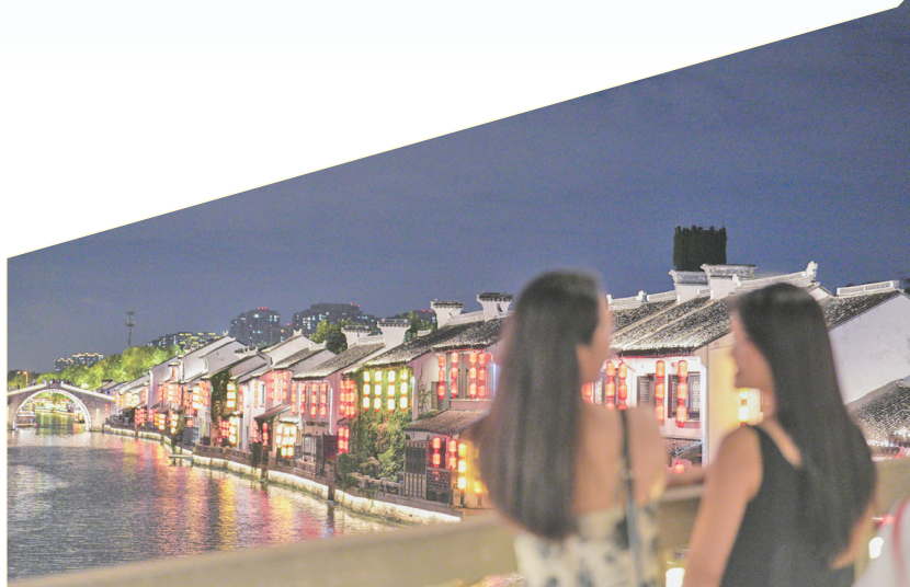
9月23日晚,游客在京杭大运河江苏省无锡市梁溪区河段游玩。