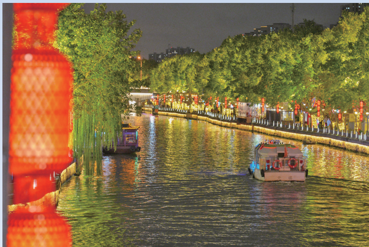
9月23日晚,京杭大运河江苏省无锡市梁溪区河段夜景。