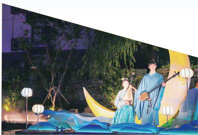
2025年9月23日,京杭大运河江苏省无锡市梁溪区河段,演艺人员在清名桥历史文化街区为游客表演节目。

期间,来自全国各地新闻摄影界的专家学者和骨干记者齐聚一堂,以马克思主义新闻观为指导,以无锡为样本,以镜头为笔、光影为墨,在古运河畔、工厂车间、湿地深处勾勒出一幅融合科技创新、生态保护与文化遗产的城市画卷,让水乡韵味、人文底蕴、发展活力与现代风采在影像中交织共鸣。