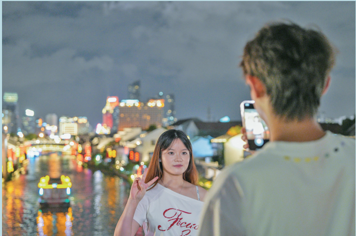
9月23日晚,游客在京杭大运河江苏省无锡市梁溪区河段拍照留念。