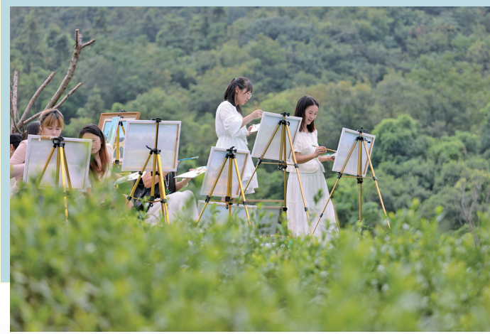
9月25日,在江苏省无锡市滨湖区状元里,市民正在体验户外绘画。