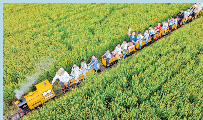
9月24日,在江苏省无锡市滨湖区“小田蜜农场”内,农文旅项目小火车在农田内穿梭。