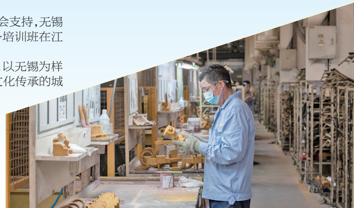
9月25日,在江苏省无锡市滨湖区一科技企业,工人正在车间作业。