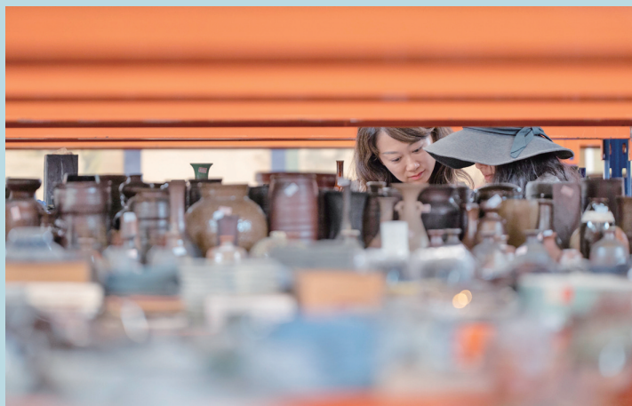
9月25日,游客在江苏省无锡市滨湖区绿波美术馆艺术集市选购文创艺术品。