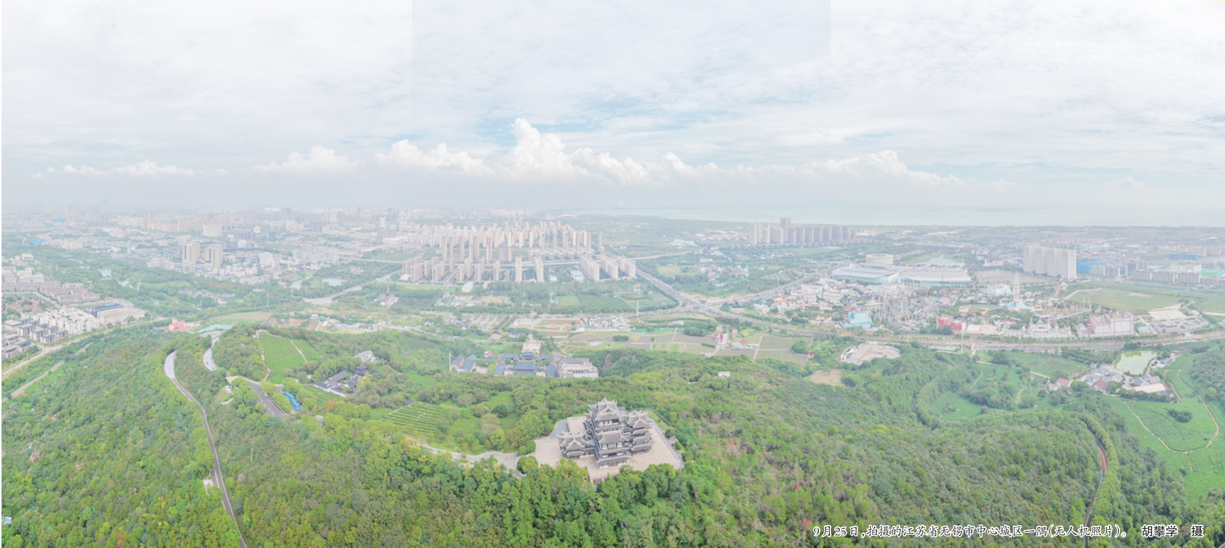
9月25日,拍摄的江苏省无锡市中心城区一隅(无人机照片)。