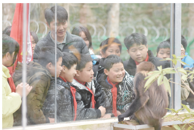
学生兴致勃勃地观察黔金丝猴。