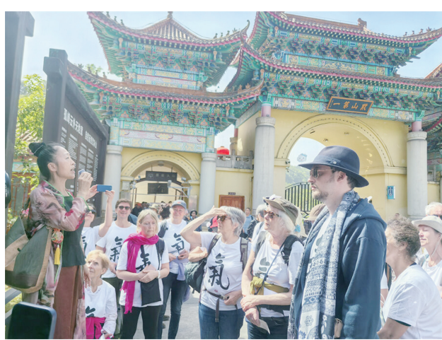
工作人员向中外游客讲解。