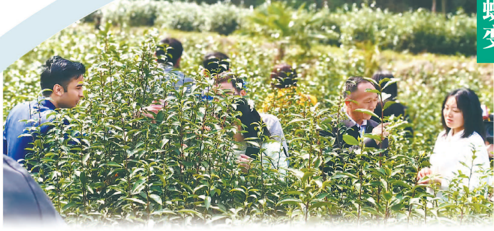
绿水青山茶园飘香。