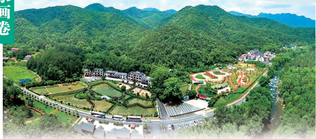
长水村高山与密林相伴,绿水与深谷相随。