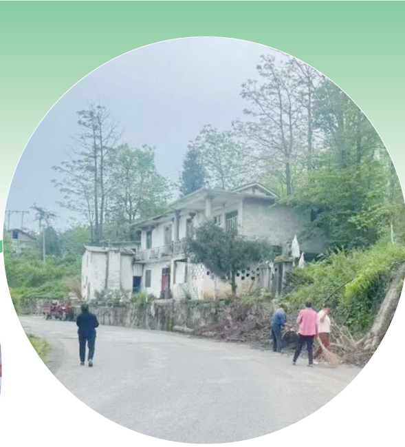
四堡村干部群众清扫村庄道路。