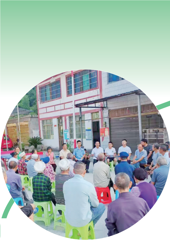
“坝坝会”向群众宣讲移风易俗的好处。