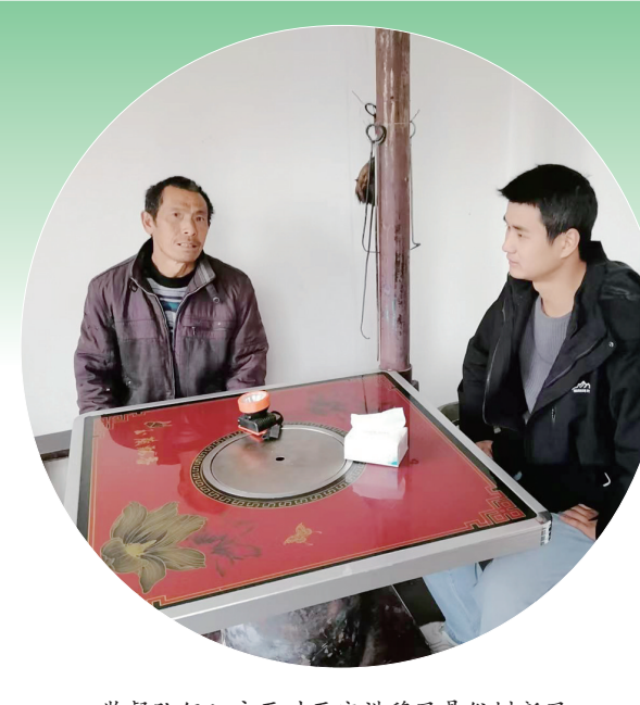
监督队伍入户面对面宣讲移风易俗新风。