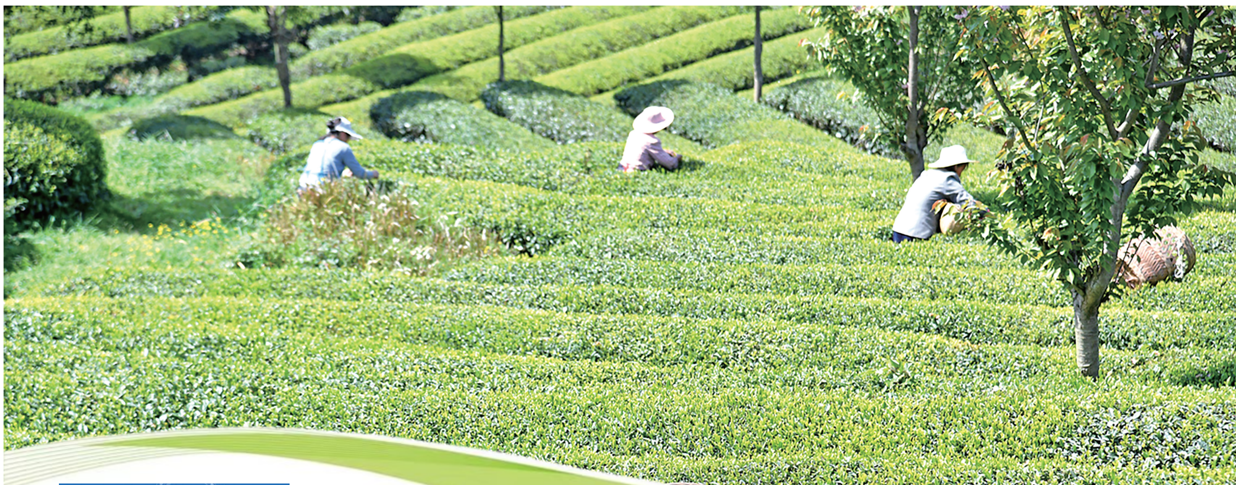
铜仁茶园风光。