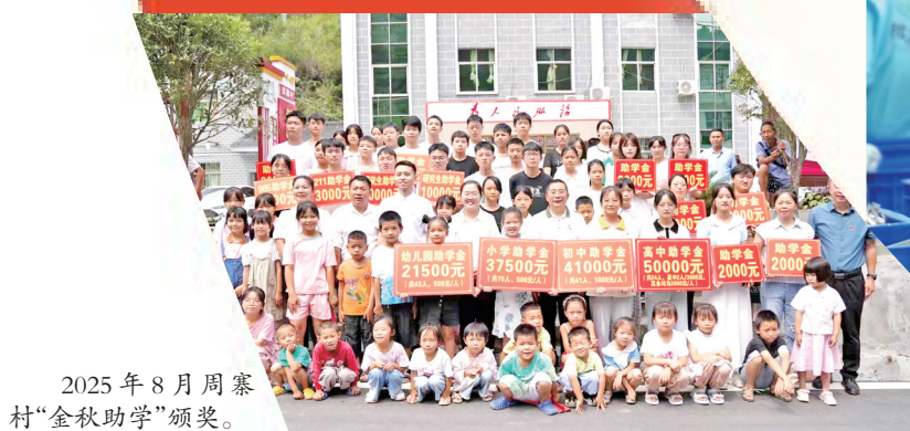
2025年8月周寨村“金秋助学”颁奖。