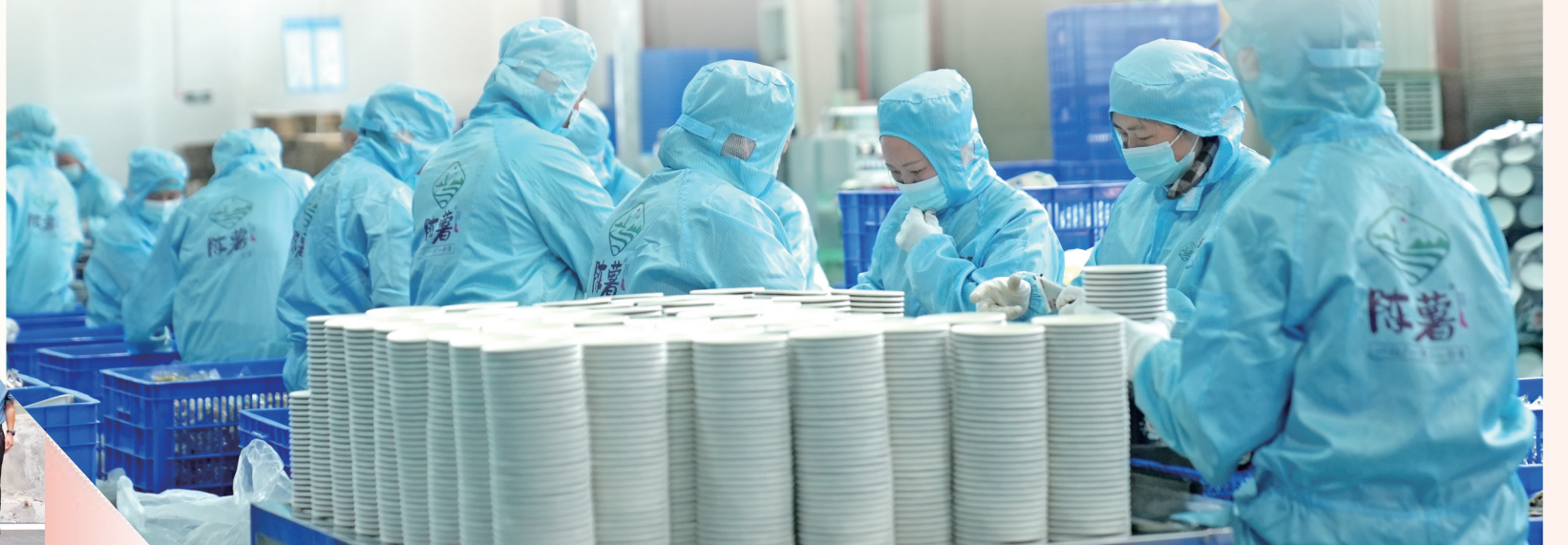
贵州佳里佳农业发展有限公司车间正在有条不紊地生产。

“正如总书记在新年贺词中所说,‘山海寻梦,不觉其远;前路迢迢,阔步而行’。”站在新的起点上,如今的周寨村,产业兴旺、生态宜居、乡风文明、治理有效、生活富裕,成为黔东南山区乡村振兴的样板村。曾经那个背着红薯走出大山的“薯娃”,如今已成长为乡村振兴一线的“领头雁”,成为乡村人才振兴的典型代表。