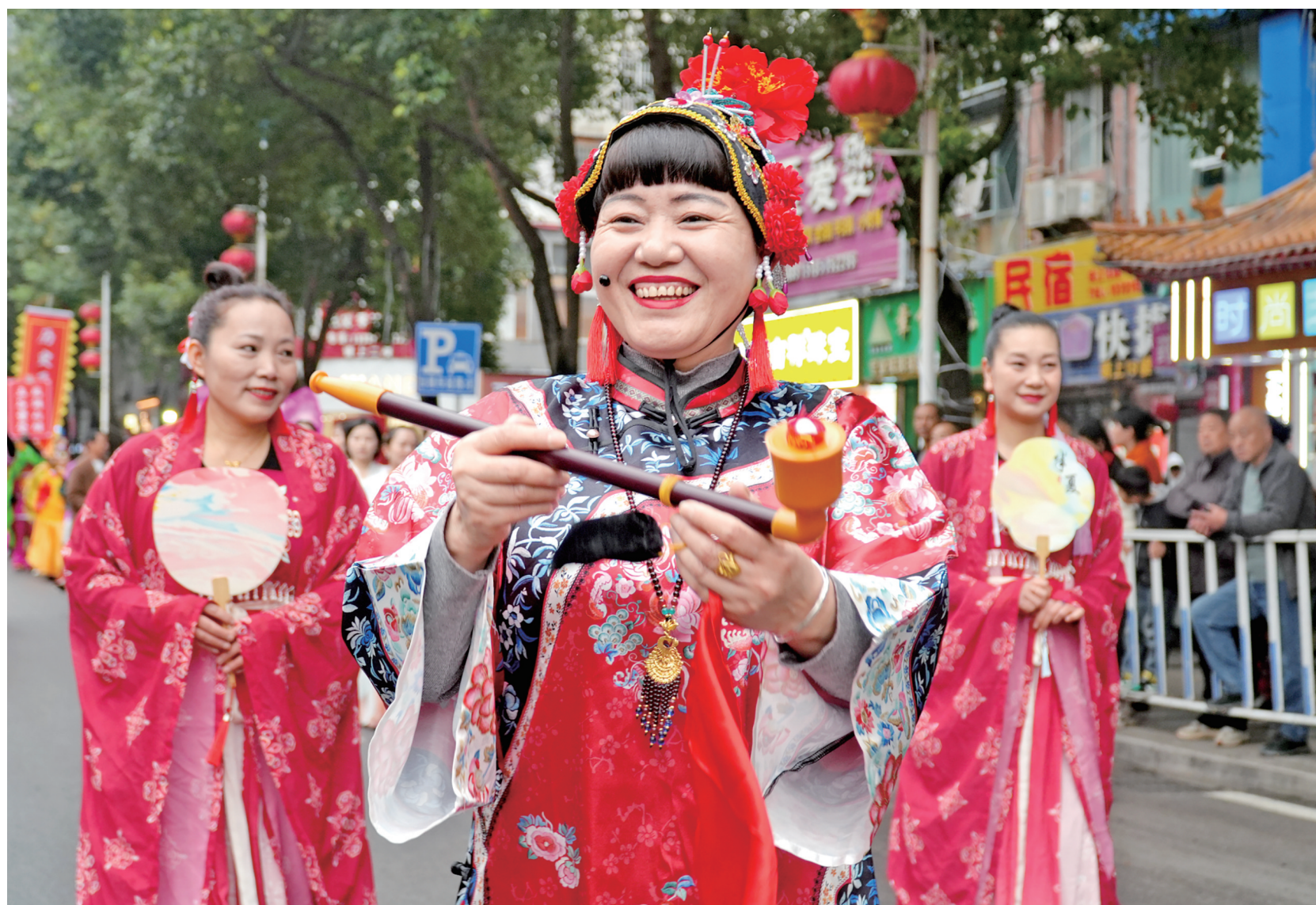
2月25日，农历正月初九，思南县举办了以“上元故事节·锦绣思南”为主题的非遗民俗巡游活动，龙灯队、醒狮队、花灯队、舞狮队、舞龙队、舞狮队等14个巡游方阵依次亮相登场，为市民与游客献上一场喜庆热闹、年味十足的新春文化盛宴。

正向引导和激励至关重要，积极引导群众从变异的人情负担中解脱出来，好好工作、生活和奋斗，每一个人皆是拍手称快，更是参与者、见证者和受益者。掌声，就是对推动工作最高褒奖。