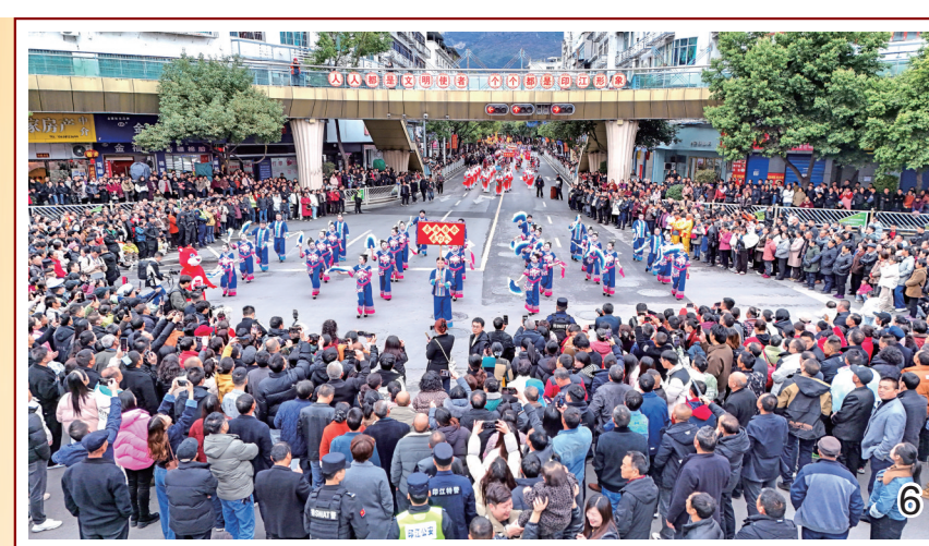
图6/7/8/9: 3月2日,印江土家族苗族自治县热闹非凡,一场以“非遗贺新春·我的家乡年”为主题的非遗花灯巡游活动精彩上演,为全县人民带来了一场极具特色的文化盛宴。