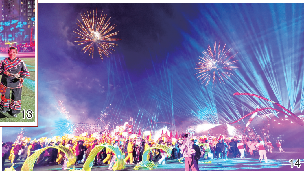
图10/11/12/13/14: 3月2日,江口县举行了新春灯会活动,民俗文化表演队和数万市民游客欢聚一堂,开展集中巡游,喜气洋洋庆祝元宵节。