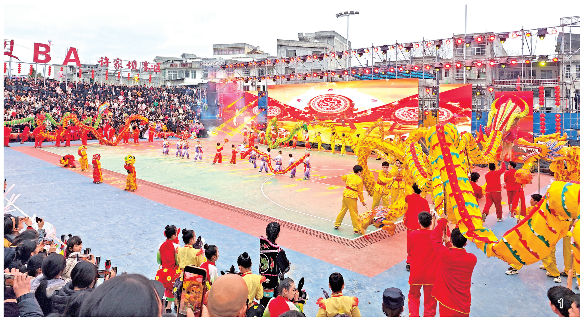
元宵佳节,我市各区县张灯结彩,灯笼高挂,年味与节日气息相融。文艺表演精彩纷呈,传统节目轮番上演,营造出热烈欢快的节日氛围,在热闹喜庆中感受传统节日的韵味,共享团圆时光。