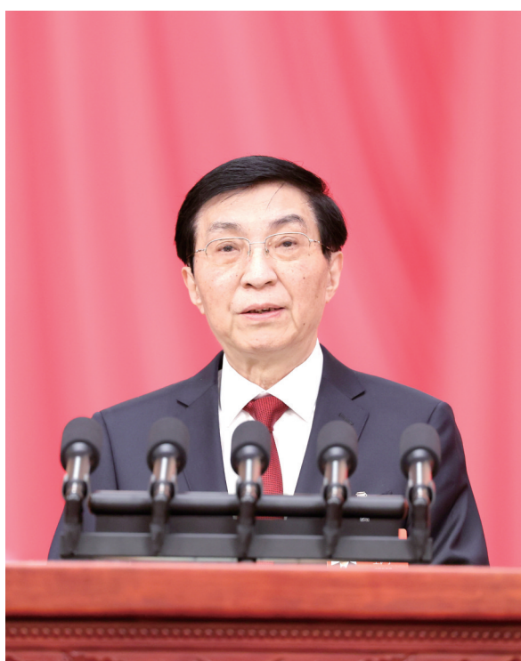
3月4日下午，中国人民政治协商会议第十四届全国委员会第四次会议在北京人民大会堂开幕。这是全国政协主席王沪宁代表政协第十四届全国委员会常务委员会，向大会报告工作。