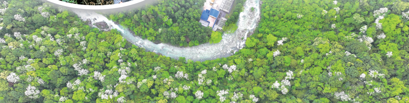
黔金丝猴研究中心。