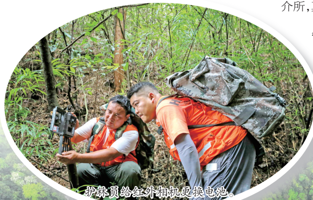
护管员给红外相机更换电池。