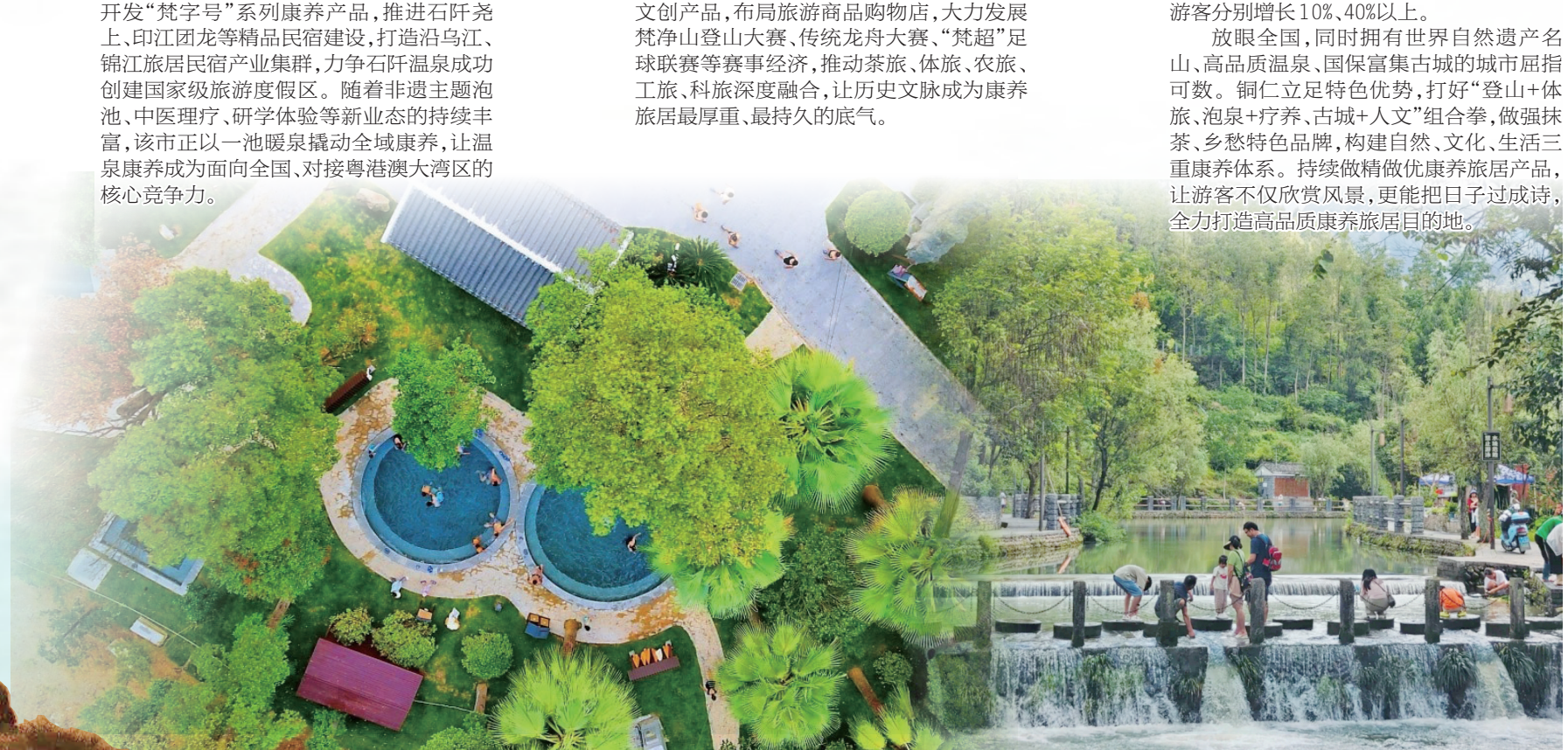
石阡古温泉。田勇摄