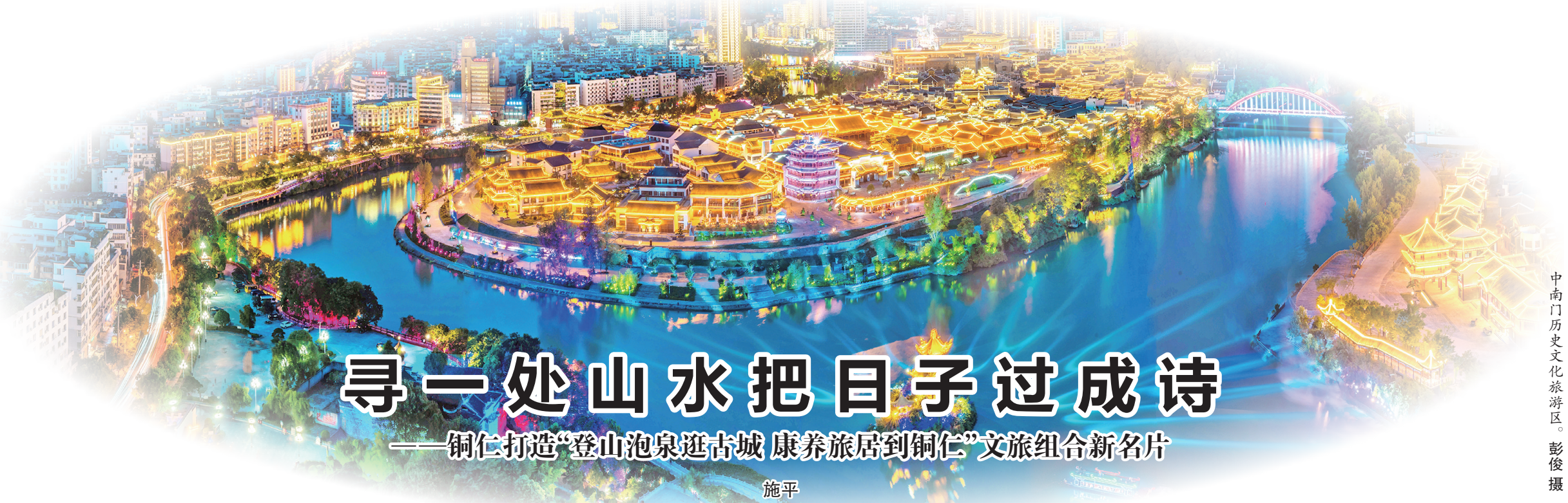
中南门历史文化旅游区。