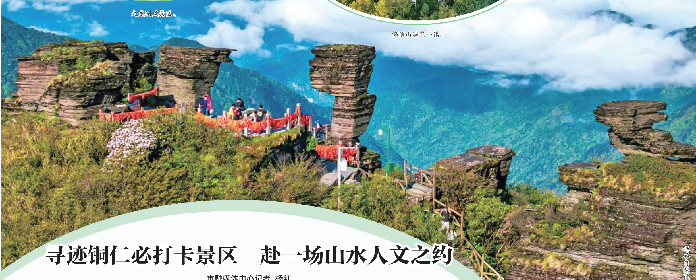
世界自然遗产地梵净山。