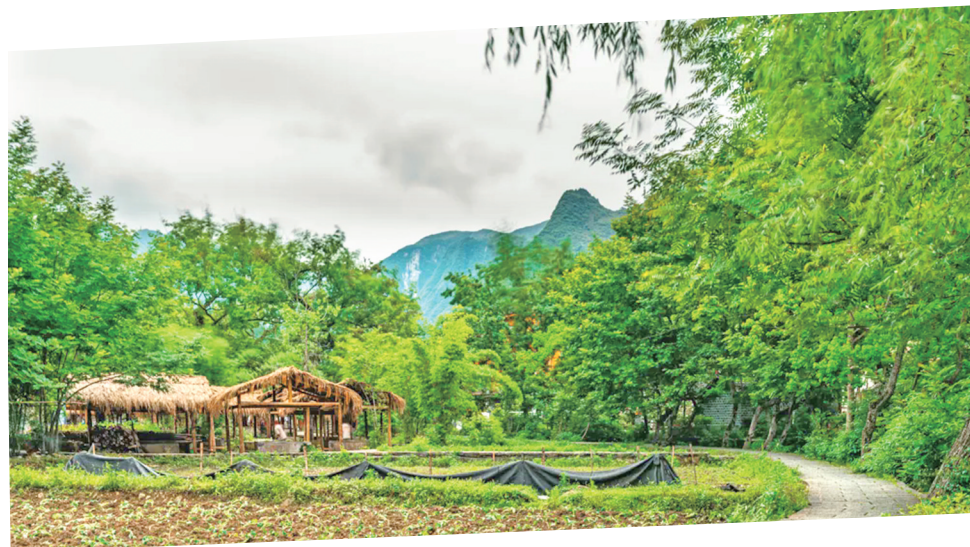
柳林溪畔，藏着百年古法造纸坊。