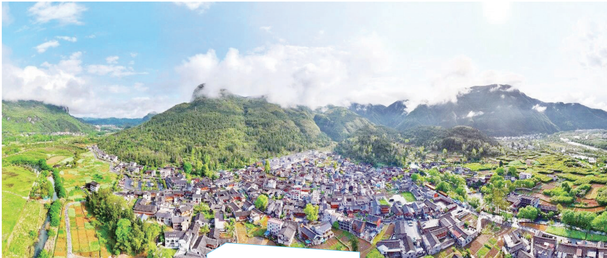
梵净山下的“世外桃源”，青山古寨，一眼沦陷。