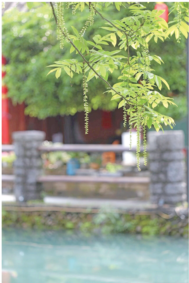
枝条依依，春意正浓。