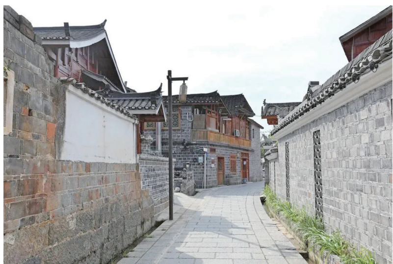
青石板路一步一景，满是烟火气。