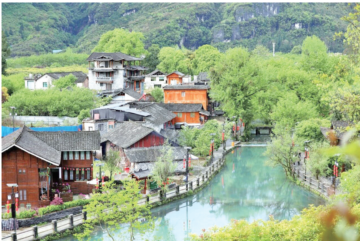
碧水潺潺，屋舍错落。