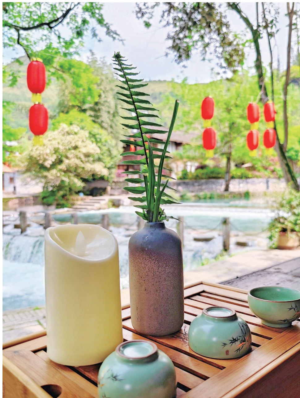
一杯清茶，赴一场温柔慢时光。