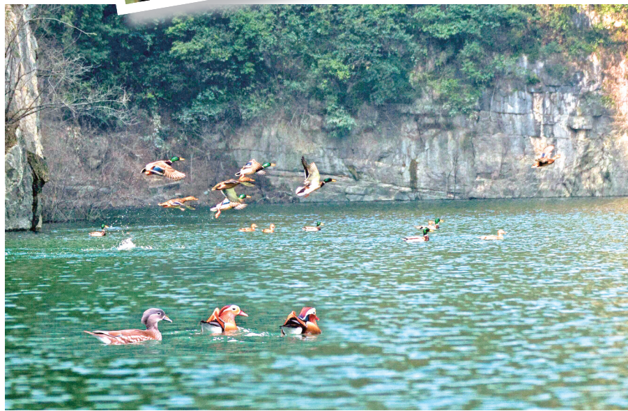
碧水漾清波，成群鸳鸯嬉戏水面。→