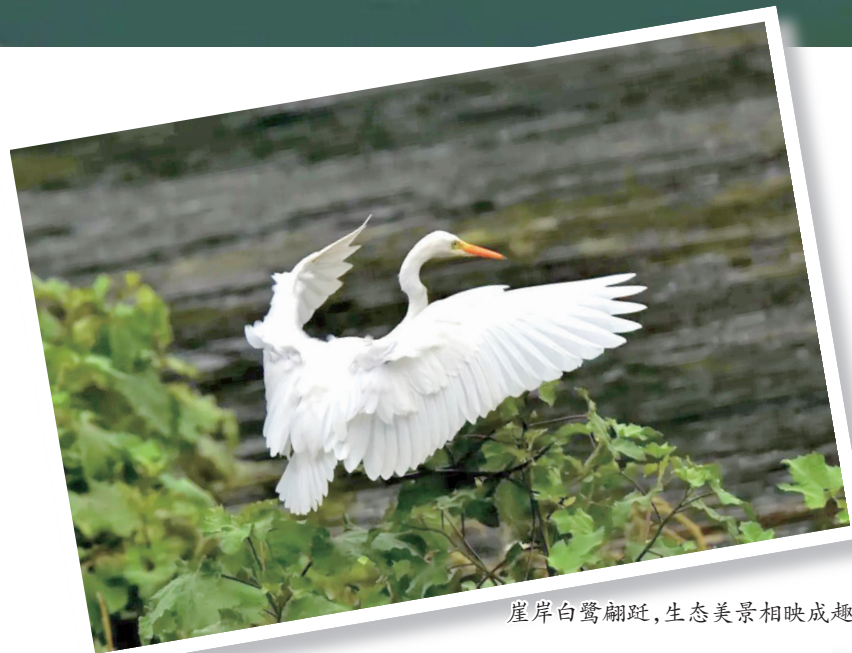
崖岸白鹭翩跹，生态美景相映成趣。