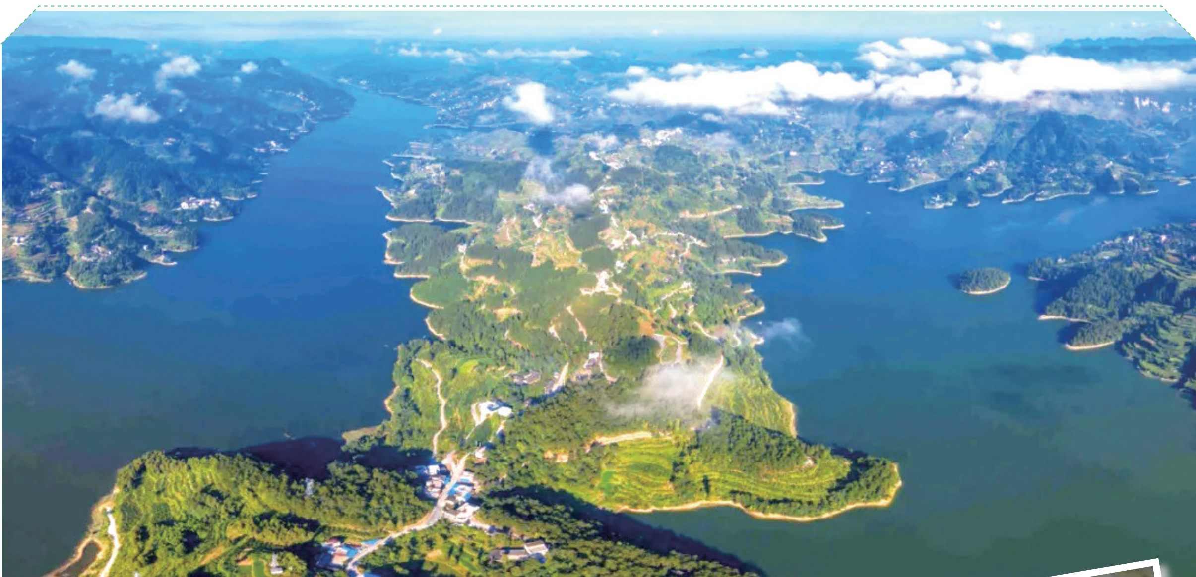
白鹭湖国家湿地公园山水湖林浑然一体，藏尽自然之美。