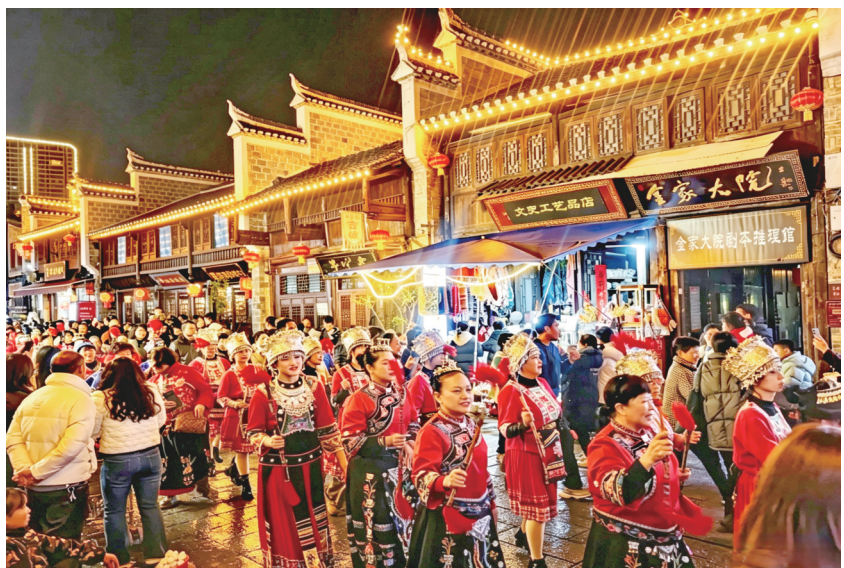
暮色漫过飞檐翘角，灯火点亮青瓦木楼，非遗巡游如流动的诗篇。