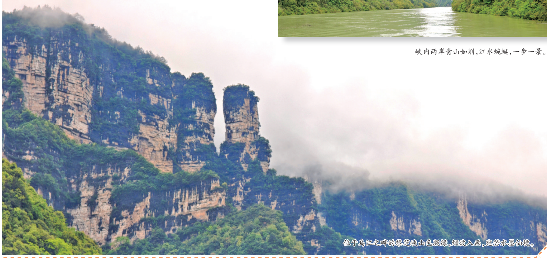
位于乌江之畔的黎芝峡山色凝绿，烟波入画，宛若水墨仙境。