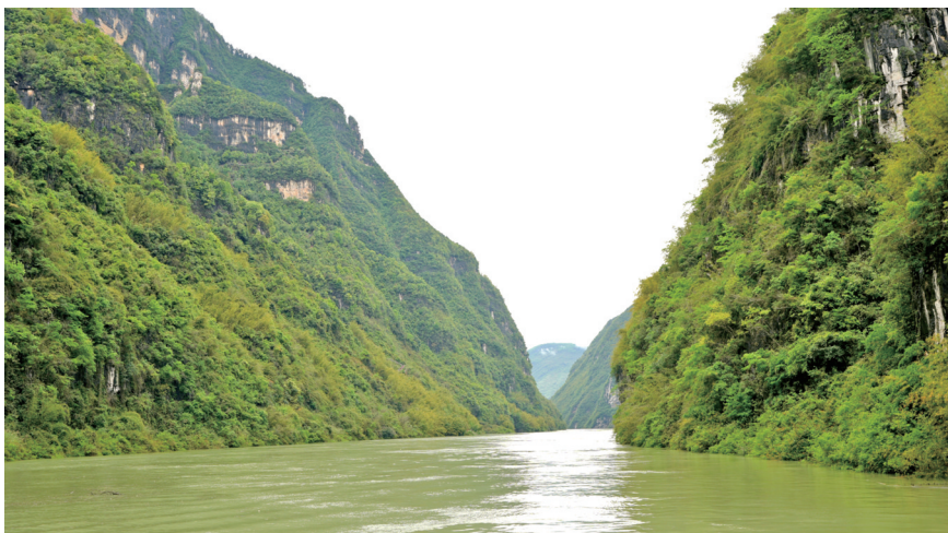
峡内两岸青山如削，江水蜿蜒，一步一景。

乘船缓缓穿行于江上，清风拂面，碧波荡漾，两岸青山次第展开，游人无不由衷感叹：“船在江中行，人在画中游。”如今，随着当地生态保护与旅游开发的持续推进，这幅“乌江画卷”正吸引着越来越多的游客前来打卡，感受山水之美、人文之韵。