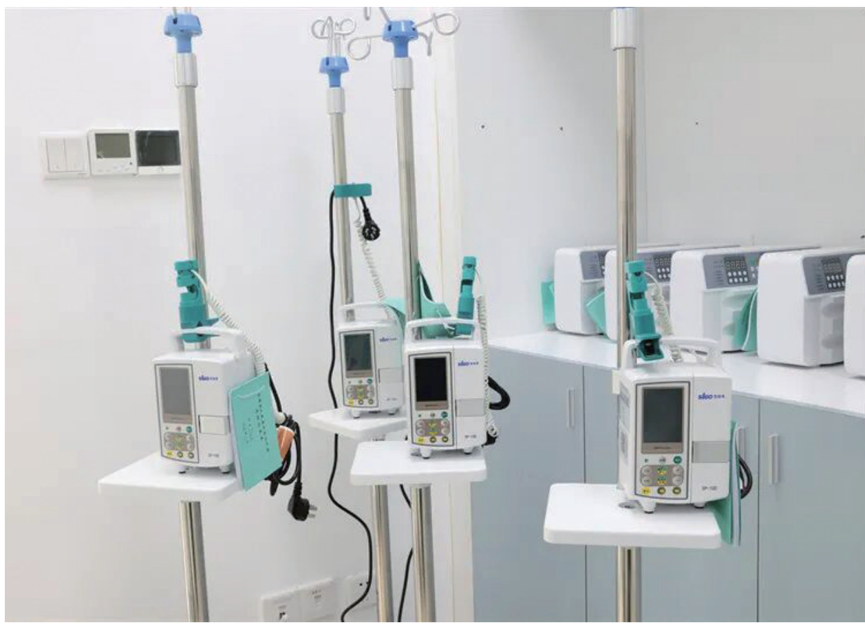
玉屏依托莞铜协作资源升级改造,配齐专业设备。

通县域救治网络系统“最后一公里”。2025年,投入320万元协作资金建成县域急危重症救治一体化中心,建成铜仁市首家、贵州省第三家同类县域急救中心。