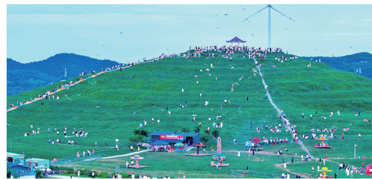
黔东草海万亩高山草场绿意盎然,风电长亭相映成趣,八方游客纵情畅游山野。

这个“五一”,来松桃!赏奇山秀水,品苗乡风情,逛古寨古镇,寻非遗苗绣,看热闹村晚,享田园慢生活。在“神奇松桃·魅力苗乡”邂逅诗与远方,度过一段治愈又难忘的假期时光。