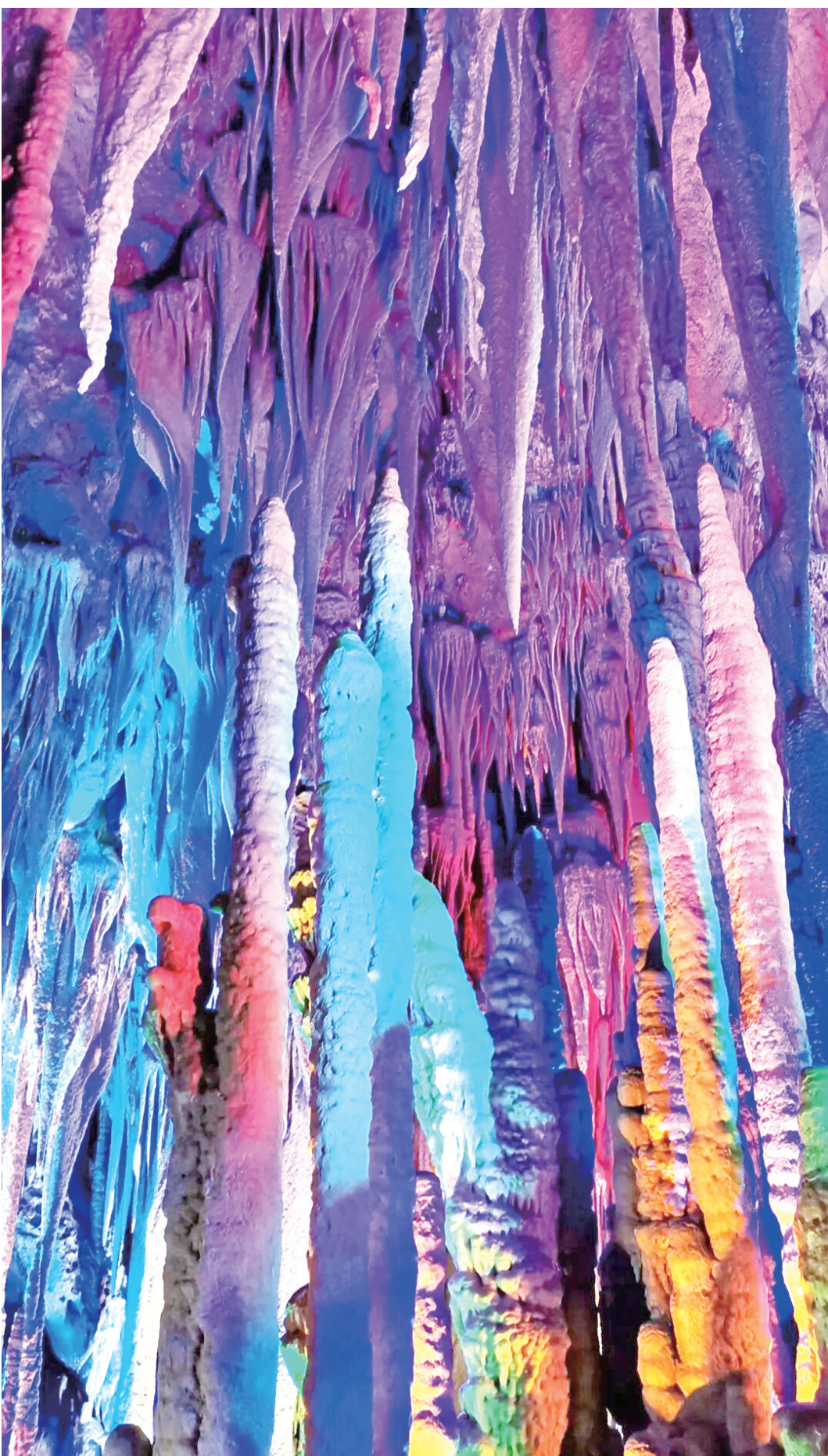
潜龙洞内千姿百态的钟乳石在光影映衬下流光溢彩,亿年溶洞奇观尽显大自然鬼斧神工。