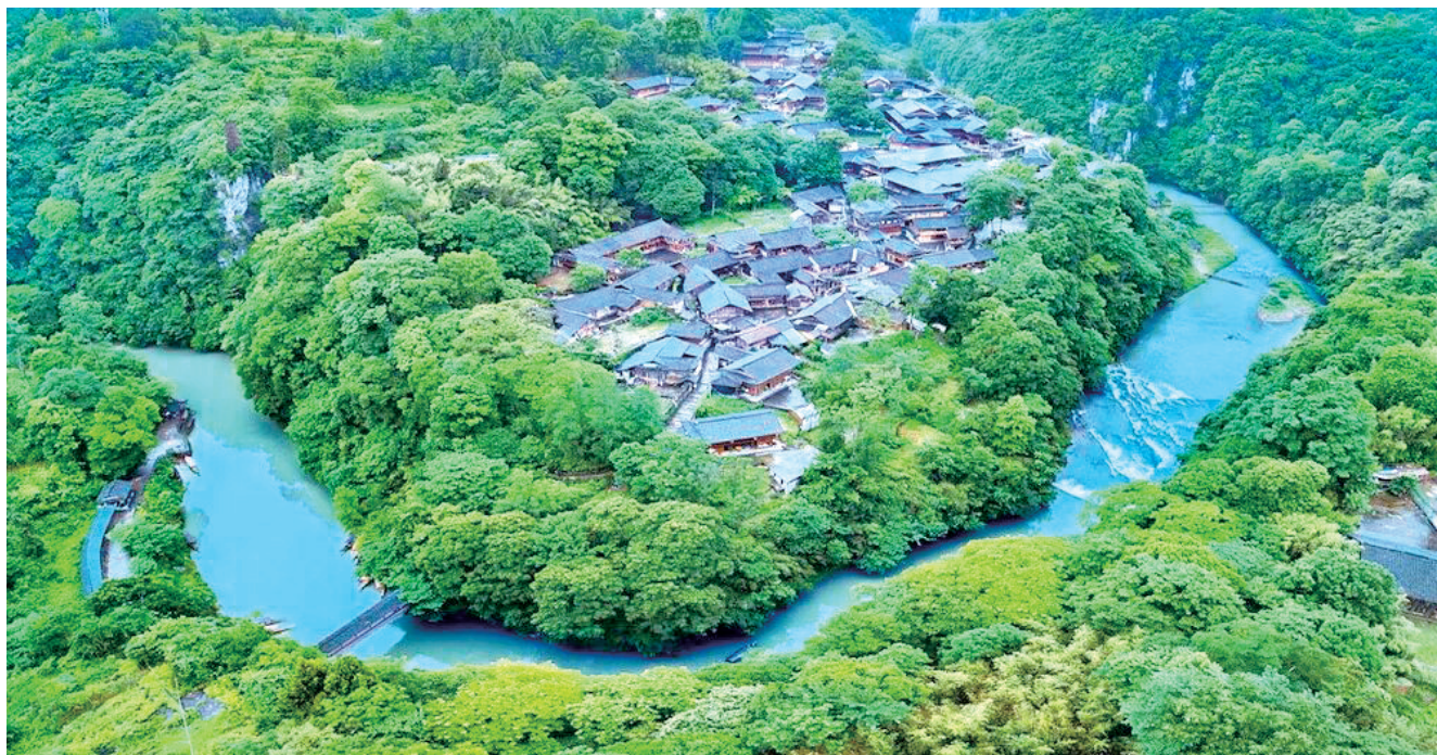
苗王城青山环绕、碧水环绕,古朴苗寨藏于绿水青山之间,完整保留千年苗族村寨风貌。