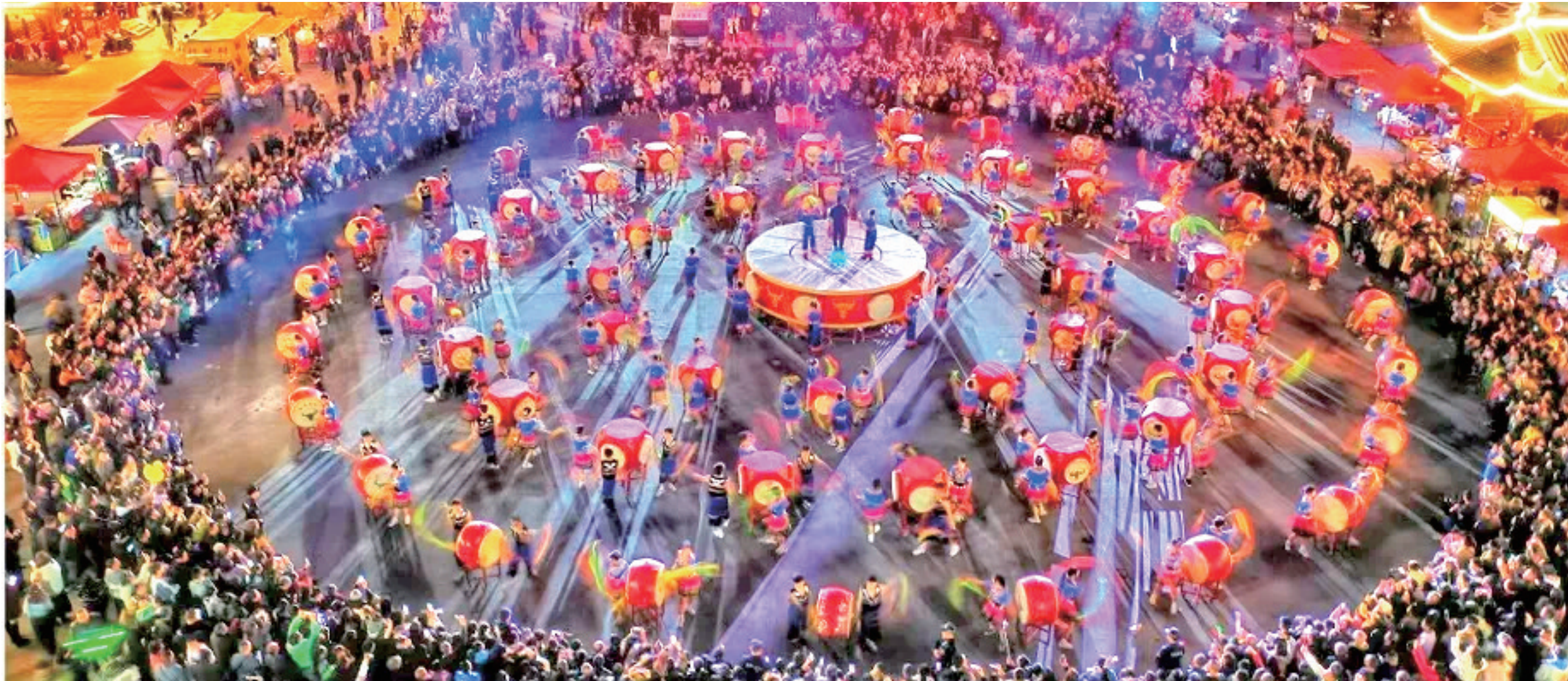
“松桃村晚”活动现场,独具魅力的苗族非遗鼓乐表演精彩上演,苗乡民俗风情与乡村文化活力满满。