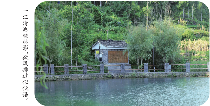
一汪清池映林影，微风拂过似低语。