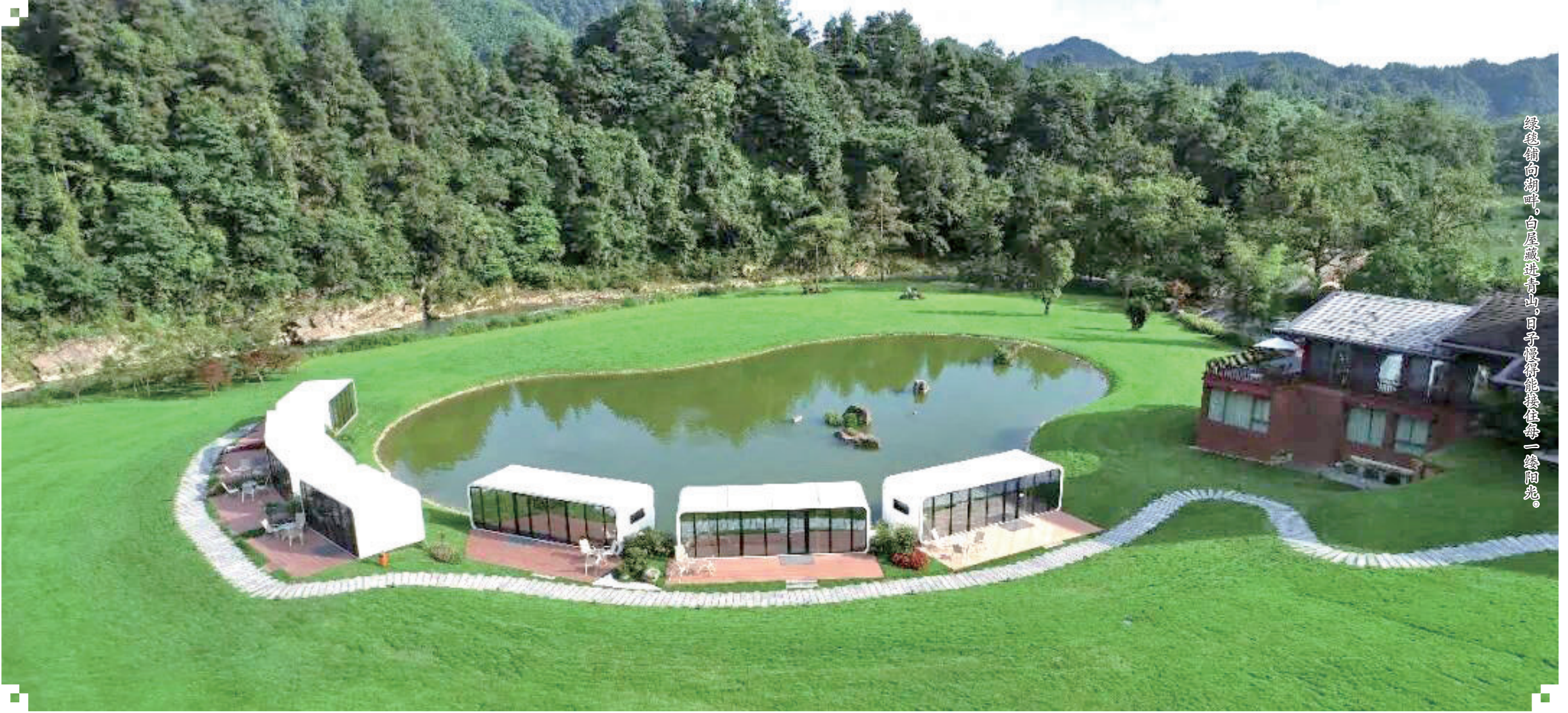
绿意铺向湖畔，白屋点缀青山，日子慢得能捕捉每一缕阳光。