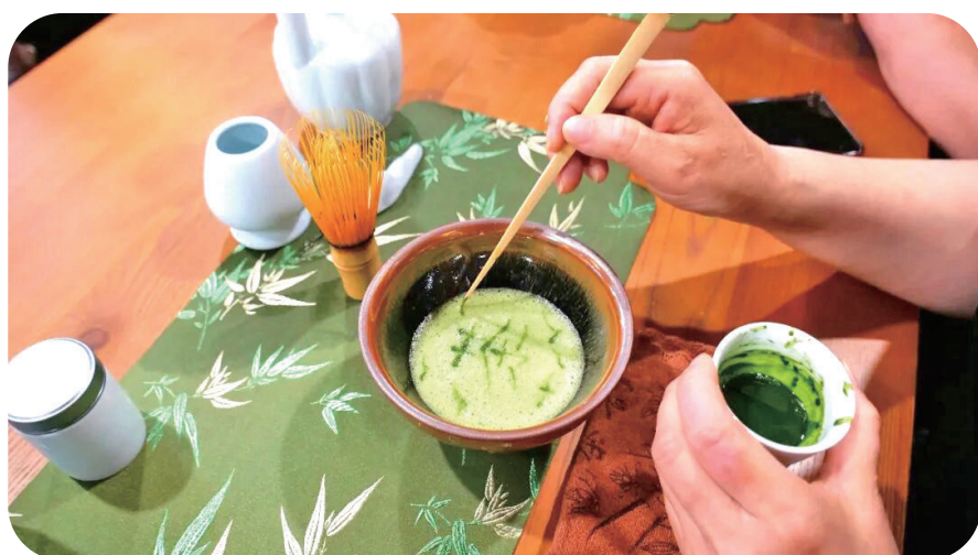
山风入怀，草木入盏，于一方茶席间慢煮岁月清欢。