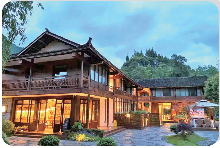
一院灯火，半窗山景，晨起听鸟鸣，暮时观斜阳，日子清宁，岁月安然。