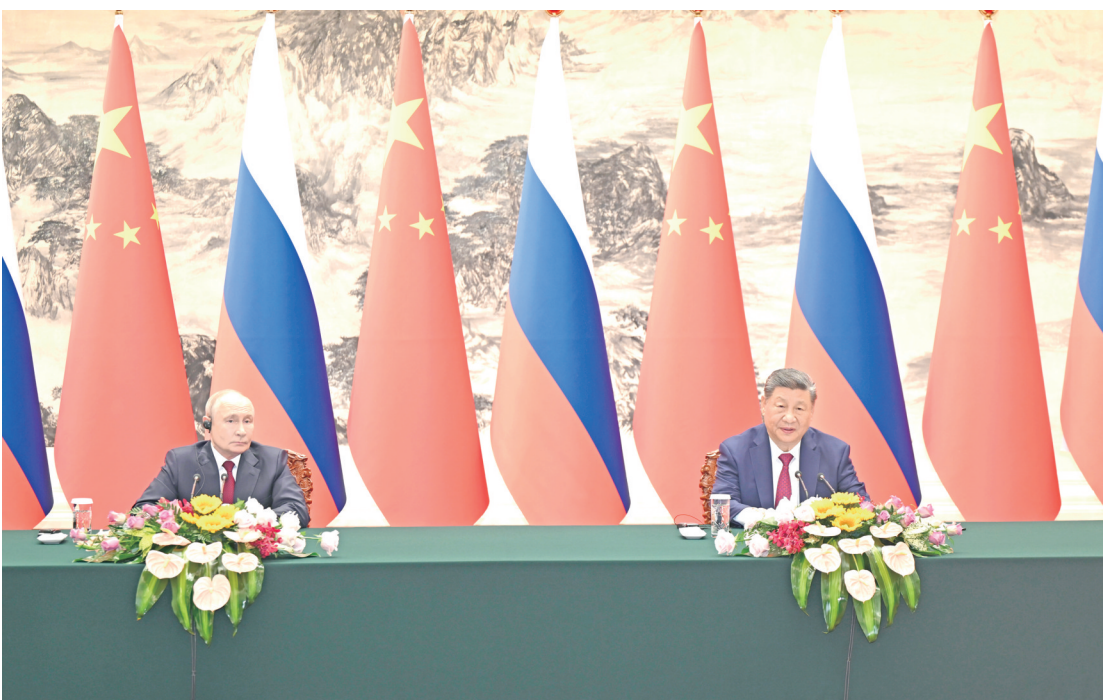
5月20日下午,国家主席习近平在北京人民大会堂同俄罗斯总统普京会谈后共同会见记者。