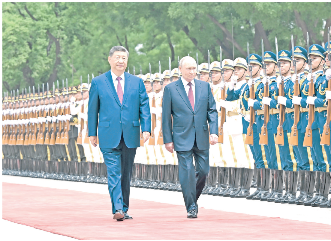
5月20日上午,国家主席习近平在北京人民大会堂同来华进行国事访问的俄罗斯总统普京举行会谈。会谈前,习近平在人民大会堂东门外广场为普京举行欢迎仪式。

普京表示,在双方共同努力下,俄中关系达到空前的高水平。高层交往密切,政治互信牢固。双边贸易稳步增长,能源供需实现互利互惠,交通、物流、科技等领域合作日益深入。人文交流势头良好,在成功举行“俄中文化年”后,“俄中教育年”将开启。俄中关系经受考验,历久弥坚,已成为全面战略协作的典范。睦邻友好合作条约成为两国关系奠定了坚实法律基础,在当前形势下具有更加重要的现实意义。俄方愿同中方一道,恪守条约精神,加强战略协调与务实合作,推动两国关系迈上更高水平。俄中合作是动荡国际形势下的重要稳定因素。俄方愿同中方继续加强多边协作,支持中国办好亚太经合组织领导人非正式会议,共同加强上海合作组织地位和影响,增强金砖国家机制团结协作,维护联合国权威,倡导文明多样性,推动国际秩序更加公正合理。(下转2版)