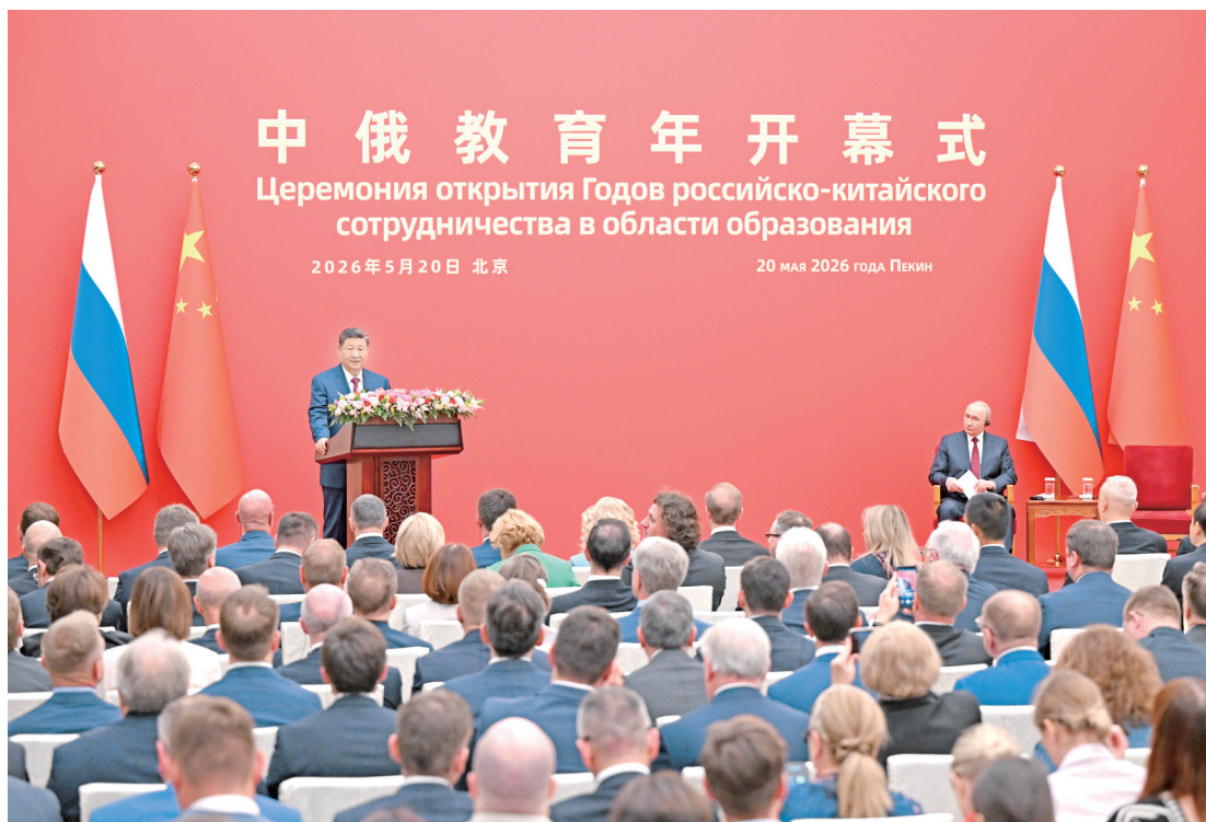
五月二十日下午,国家主席习近平同俄罗斯总统普京在北京人民大会堂共同出席“中俄教育年”开幕式。