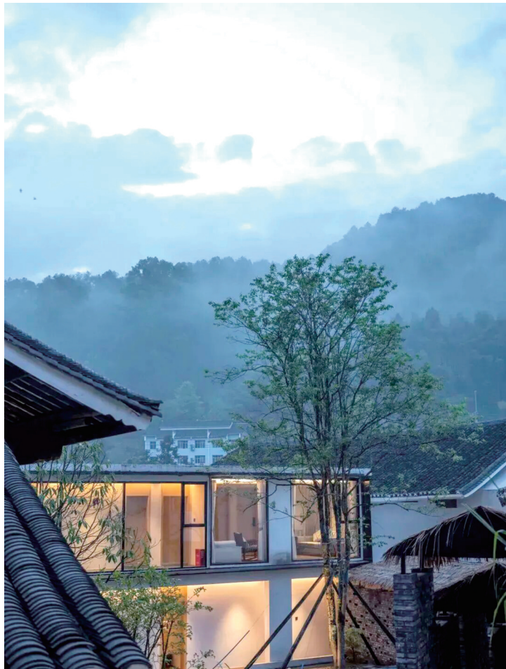
远山藏诗意,古舍隐清欢,一院山居,盛满岁月静好。