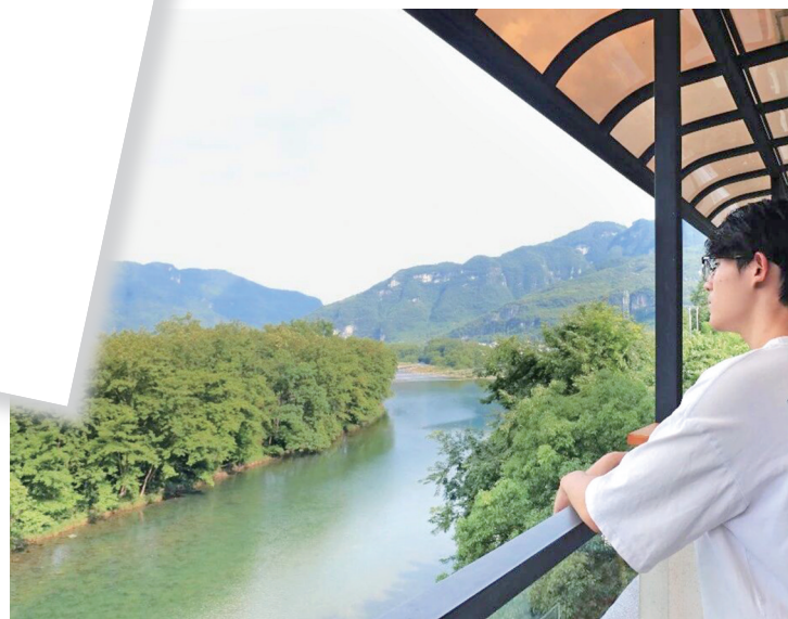
凭栏观溪山,清风入襟怀,静揽江口山野清境。