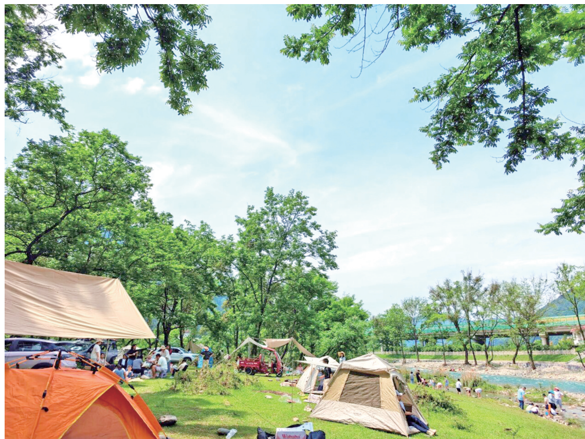
扎帐青山下,闲伴草木风,赴一场山野康养之约。