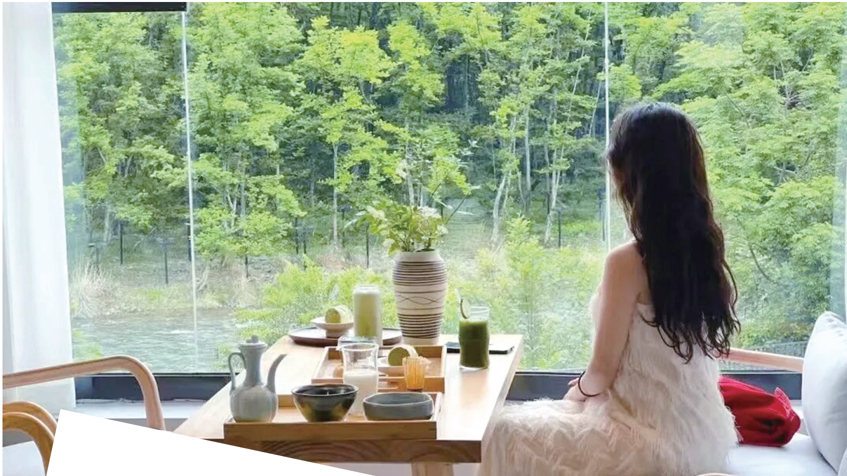
树影漫青山,清风入怀来。