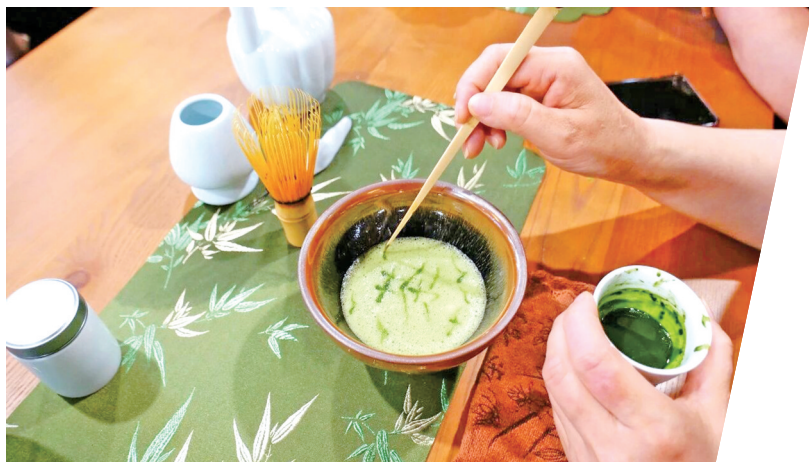
煮茶待清欢,把俗世喧嚣,都融于一抹温柔。