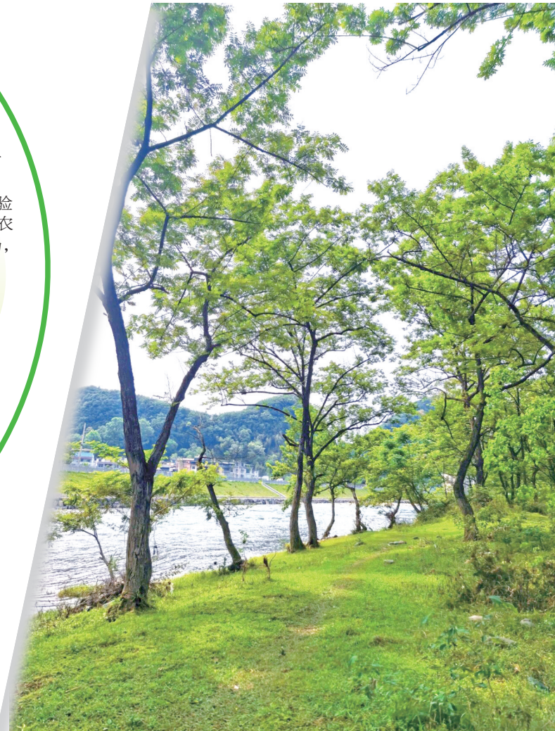
浅林覆清境,风软云悠然,山野藏情趣,岁月自安然。

雅致山居隔绝喧嚣,推窗见青山,卧听溪水声。伴 着清风安睡,在鸟鸣晨雾中醒来,让身心在自然里 彻底放松。来江口,于山水间养回元气,邂逅治 愈的旅居时光。