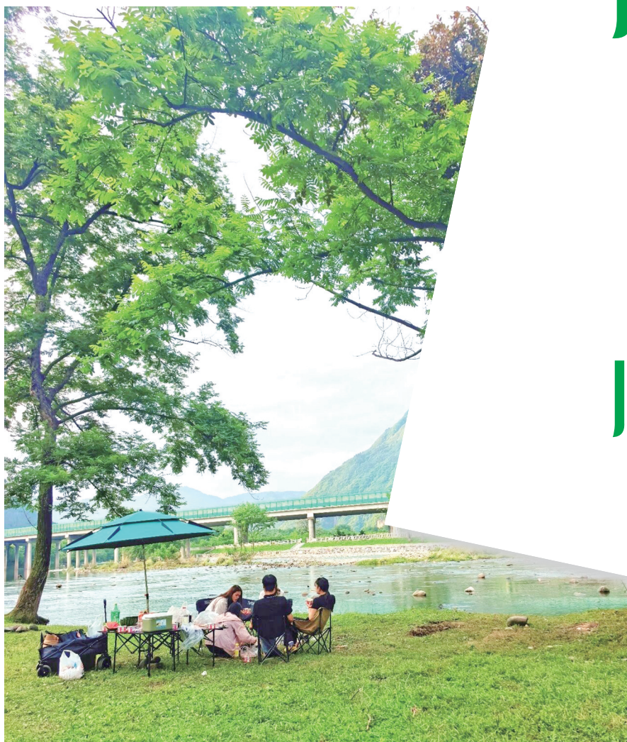
倚绿茵而坐,于太平河畔沐清风闲谈。