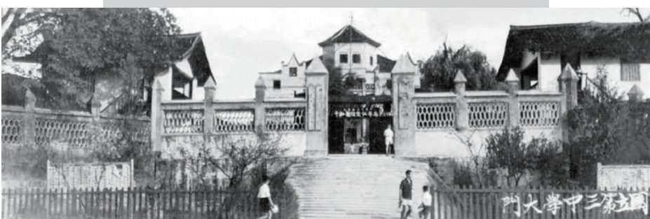
国立第三中学大门