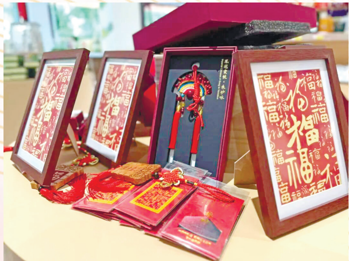
“铜五福”文旅伴手礼系列之朱砂文创产品